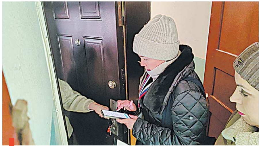
Обходчики уточняют списки зарегистрированных избирателей