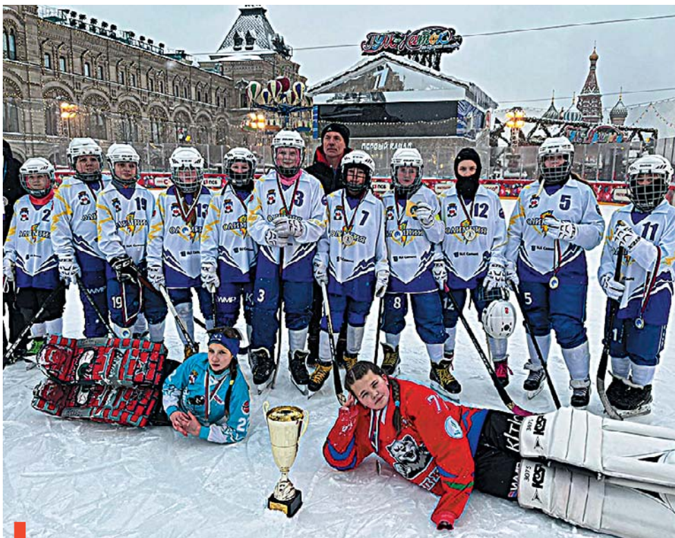
Сухоложские хоккеистки с долгожданным серебряным кубком