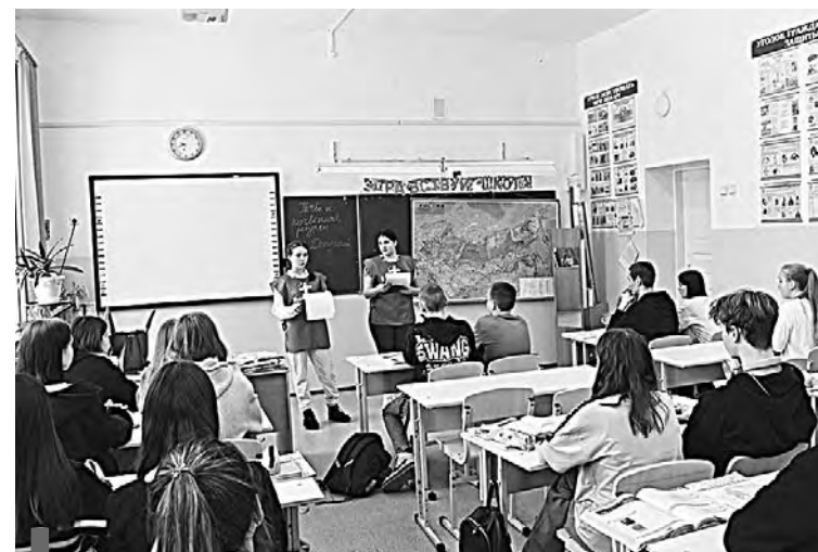
Лекция о здоровом питании в школе №2