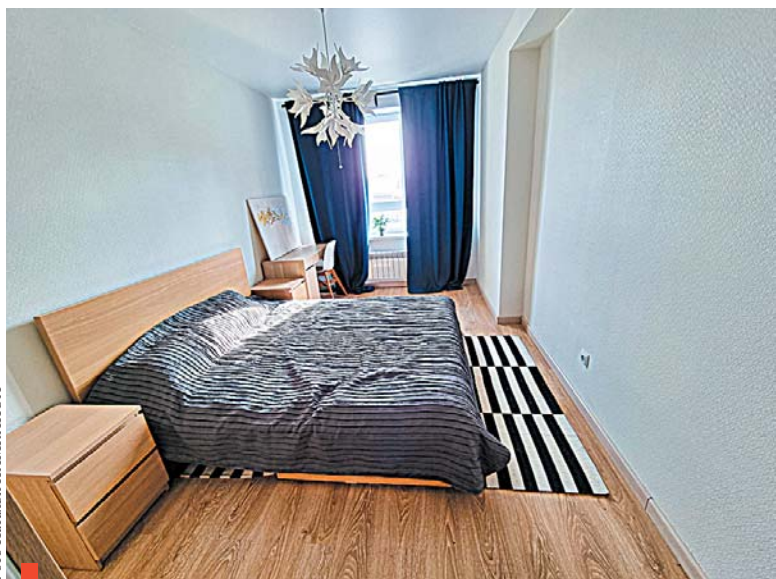
Чистовая отделка в каждой квартире