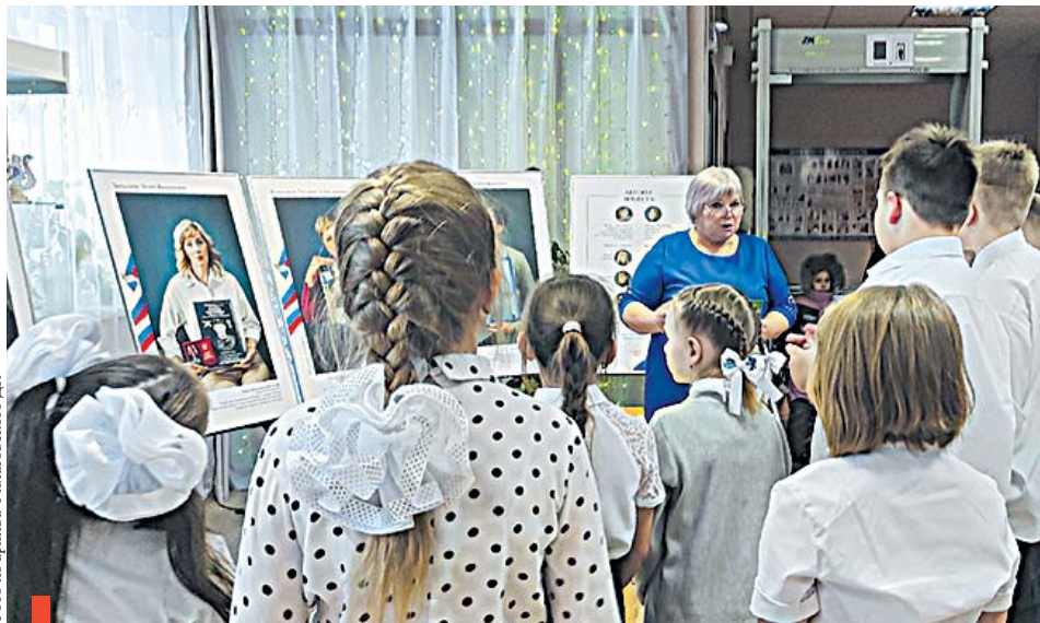
Презентация выставки «Мамы героев» в с. Филатовском

Мы продолжим твердой рукой ставить на место непослушные знаки препинания. Сосредоточимся на запятых и обособлении в предложениях распространенных определений. Будем много практиковаться, расширяя школьные познания.