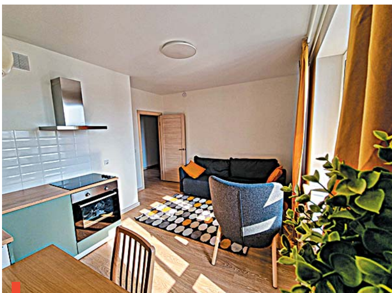
Квартира с мебелью и техникой в ЖК «Белинский»

В 2023 году аренда квартир на российском рынке недвижимости выросла в цене в среднем на 15%. По мнению экспертов, эта тенденция продолжает сохраняться и даже набирает обороты. Сильное повышение цен на квартиры просто не оставляет россиянам выбора между арендой и покупкой. Ведь купить готовое жилье теперь не позволяет высокая ставка на вторичку. Именно по этой причине на рынке наблюдается острая нехватка арендного жилья. Люди не могут позволить себе купить квартиру, поэтому откладывают покупку и арендуют жилье.