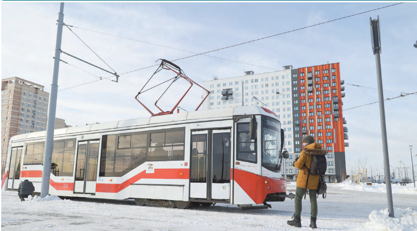
В Екатеринбурге запустили новую трамвайную линию в микрорайон Солнечный. Жители новостроек стремительно растущей территории теперь смогут быстрее и без пробок добраться до центра. Пока город не смог приобрести новые вагоны, при этом в муниципалитете пообещали не снимать старые с других линий. Пошли другим путем: продлили девятикилометровый маршрут № 9 от станции метро «Ботаническая» — теперь трамваи следуют до улицы Чемпионов.