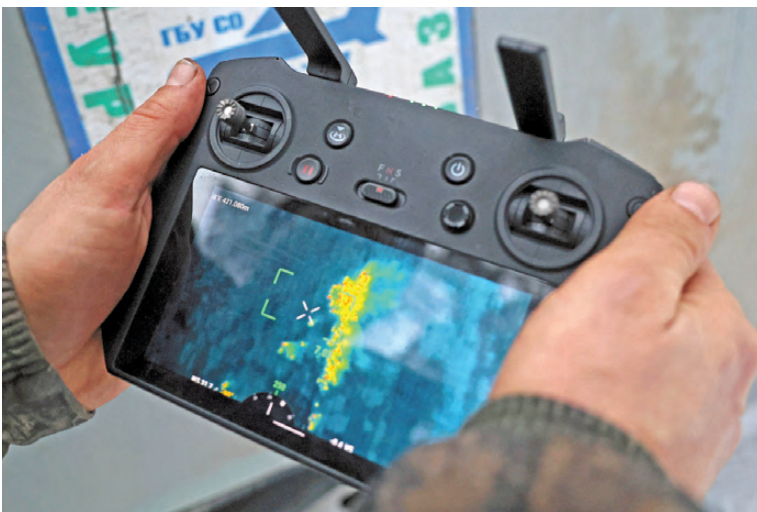
Подземный пожар виден на экране тепловизора.