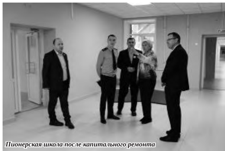
Пионерская школа после капитального ремонта

Алена Дудина Анастасия Мохнашина