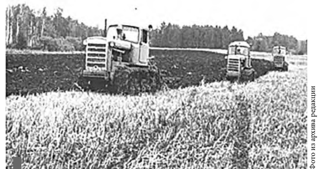
Уборочная на полях совхоза «Сухоложский» 1977 г.

В январе 1964-го произошло разделение укрупненного хозяйства. Куринское отделение в числе первых стало самостоятельным совхозом «Сухоложский».