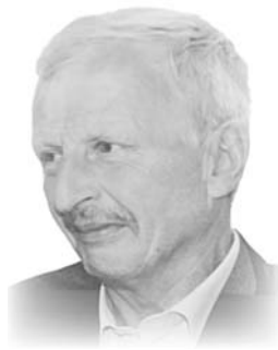
Жена, сыновья, снохи, внук, внучки, правнук

Припозднился вечер, а тебя всё нет, Зажигаю свечи, глазу твой портрет. Задрожали свечи, катится слеза, То, что время лечит, – это всё слова.