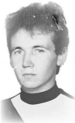
Родные и близкие

Никто не смог тебя спасти, Ушел из жизни очень рано, Но светлый образ твой родной Мы будем помнить постоянно.