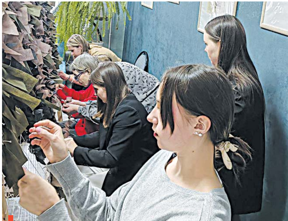
Претендентки на корону «Мисс Сухой Лог – 2024» помогают участникам СВО

Так, претендентки на звание «Мисс Сухой Лог 2024» побывали в гостях у нас в редакции и подключились к патриотичному делу – плетению маскировочных сетей. Напомним, в редакции газеты «Знамя Победы» (ул. Пушкинская, 4) сухоложцы могут оказать участникам СВО гуманитарную или финансовую помощь, а также подключить сети, принести материал для плетения или чистые банки для литья свечей.