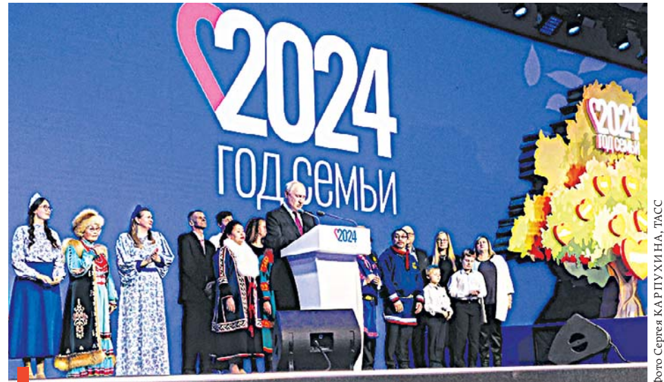
Торжественная церемония старта Года семьи в России

Президент подписал Указ «О мерах социальной поддержки многодетных семей», закрепляющий их статус. Согласно документу теперь в России многодетными будут считаться семьи, в которых воспитываются трое и более детей, а старшему не исполнилось 18 лет или 23-х в зависимости от того, продолжает ли ребенок обучение по очной форме. Регионам дано право расширять и сам статус, и меры поддержки, но не снижать их. Все многодетные семьи Свердловской области, воспитывающие трех и более детей, получают удостоверения федерального образца, а информация о них войдет в