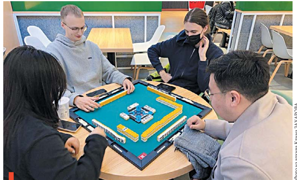
Самая популярная игра у китайской молодежи – маджонг

матичнее. А еще китайцам нравятся русские и европейцы. Мужчины от наших девушек просто без ума, так как они ухоженные (прическа, макияж, маникюр, стильная одежда) и более женственные. Да и китайки, выбирая между парнем европейской наружности и своим соотечественником, скорее, отдадут предпочтение первому (такой активный интерес я испытал на себе).