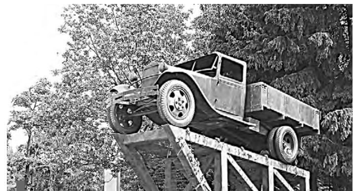
«Памяти машины-солдата» – надпись на постаменте мемориала «Полуторка» в г. Всеволожске, 2013 г.

Несколько лет назад судьба занесла меня в места, где проходила Дорога жизни: во Всеволожский район Ленинградской области. Конечно, я побывала на легендарной трассе.