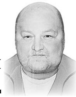
Мама, сестра, племянники

Кто знал его и помнит, помяните добрым словом. Светлая память и вечный покой.