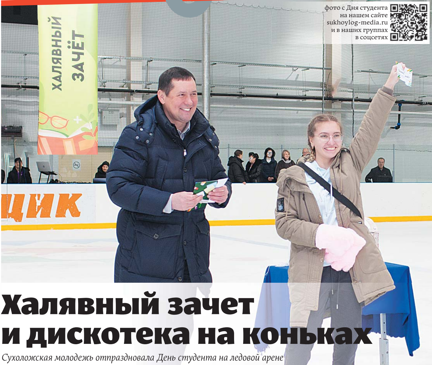
фото с Дня студента на нашем сайте sukhoilog-media.ru и в наших группах в соцсетях

В конкурсе примут участие представители 14 муниципалитетов Свердловской области: 61 вокалист и 13 ансамблей