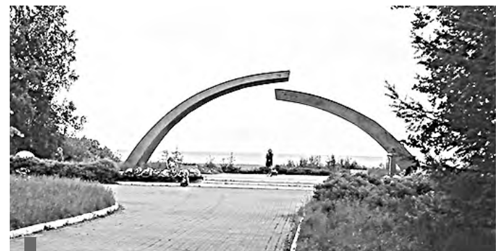
В 2015 году под дугами «Разорванного кольца» был зажжен Вечный огонь