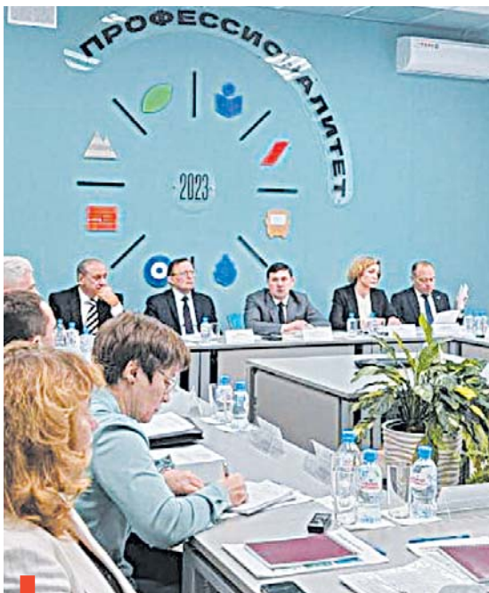
Заседание наблюдателей кластеров

Вопрос взаимодействия образовательных организаций и предприятий приобрел особую важность в свете начатой в прошлом году губернатором Евгением Куйвашевым реформы системы среднего профессионального образования. С 2023 года отраслевые министерства в пилотном режиме курируют 16 колледжей, помогая им осуществлять связь с предприятиями как с будущими работодателями выпускников. Планируется, что