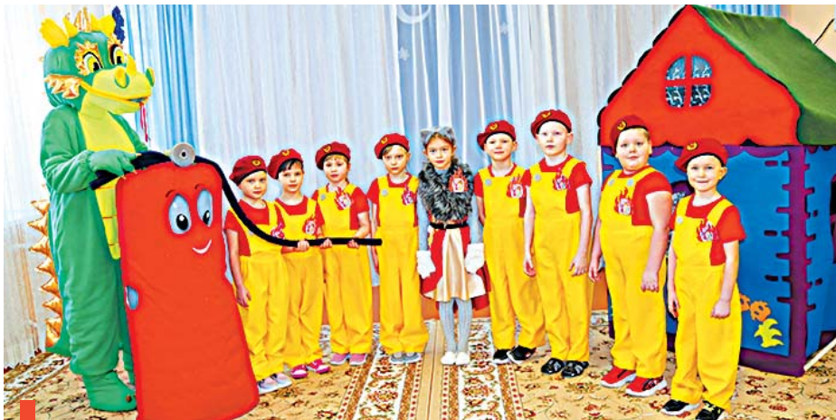
Команда «Фактор 0»

Игра – основной вид детской деятельности, благодаря ей малыши упражняются в ловкости и трени-