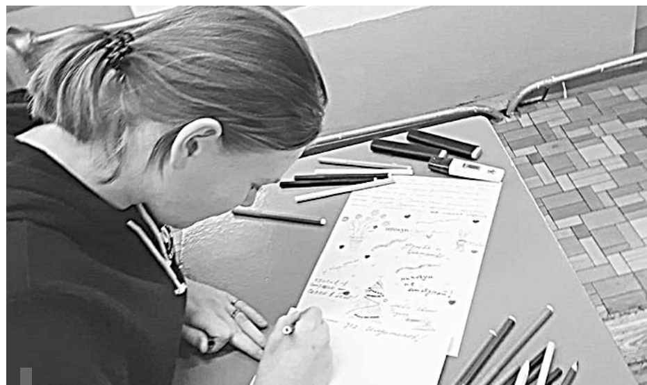
Участница акции «Письмо солдату»