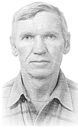
Жена, родные, близкие

40 дней на свете нет тебя, 40 дней – не много и не мало. 40 дней, а сердцу всё больней, Как тебя нам не хватает!