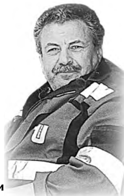
Жена, дети, внуки

Тебя уж нет, а мы не верим, В душе у нас ты навсегда. И боль свою от той потери Не залечить нам никогда.