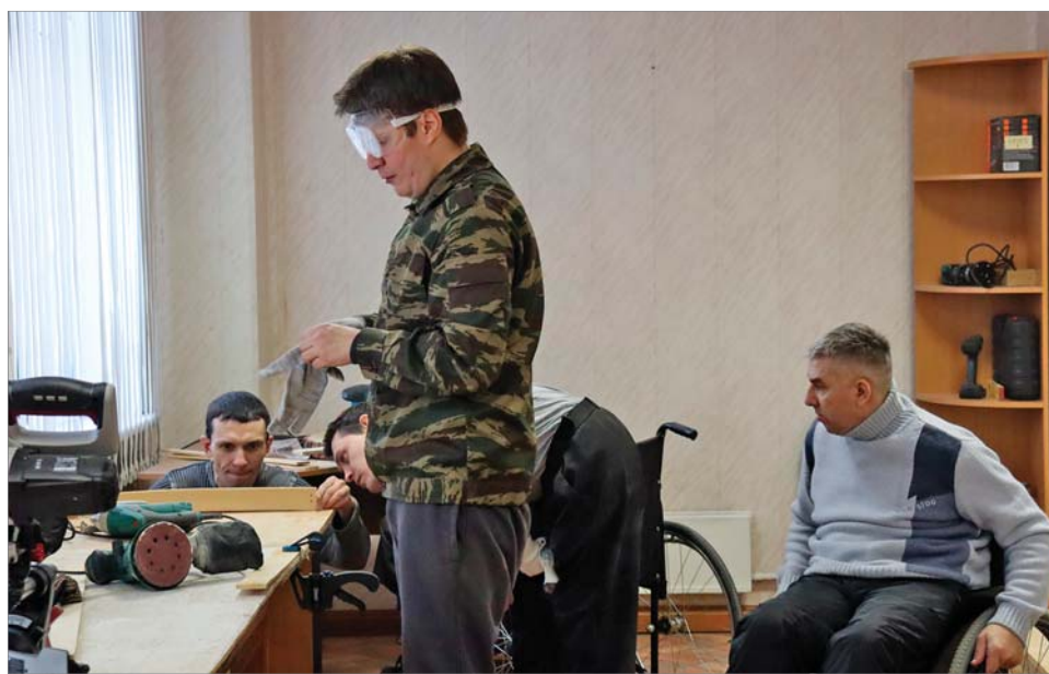
Первый день в столярной мастерской.