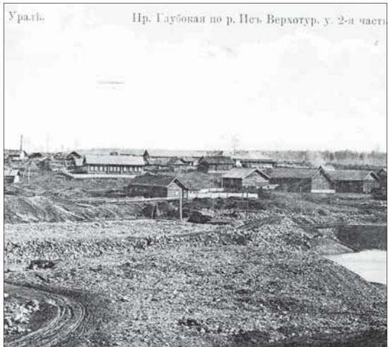
Уралье. Пр. Глубокая по р. Петь. Верхотур, у. 2-я часть

В этой казарме нам пришлось прожить до 1918 года, до Великой Октябрьской социалистической революции.