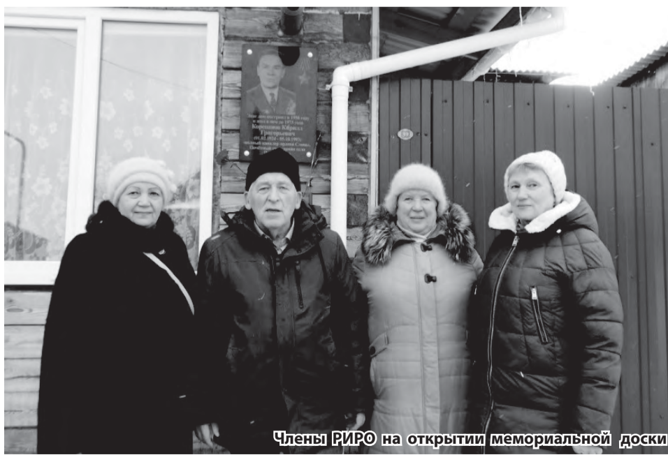
Члены РИРО на открытии мемориальной доски