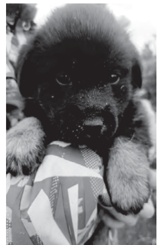
ЩЕНКИ. От крупной собаки, возраст 3 месяца