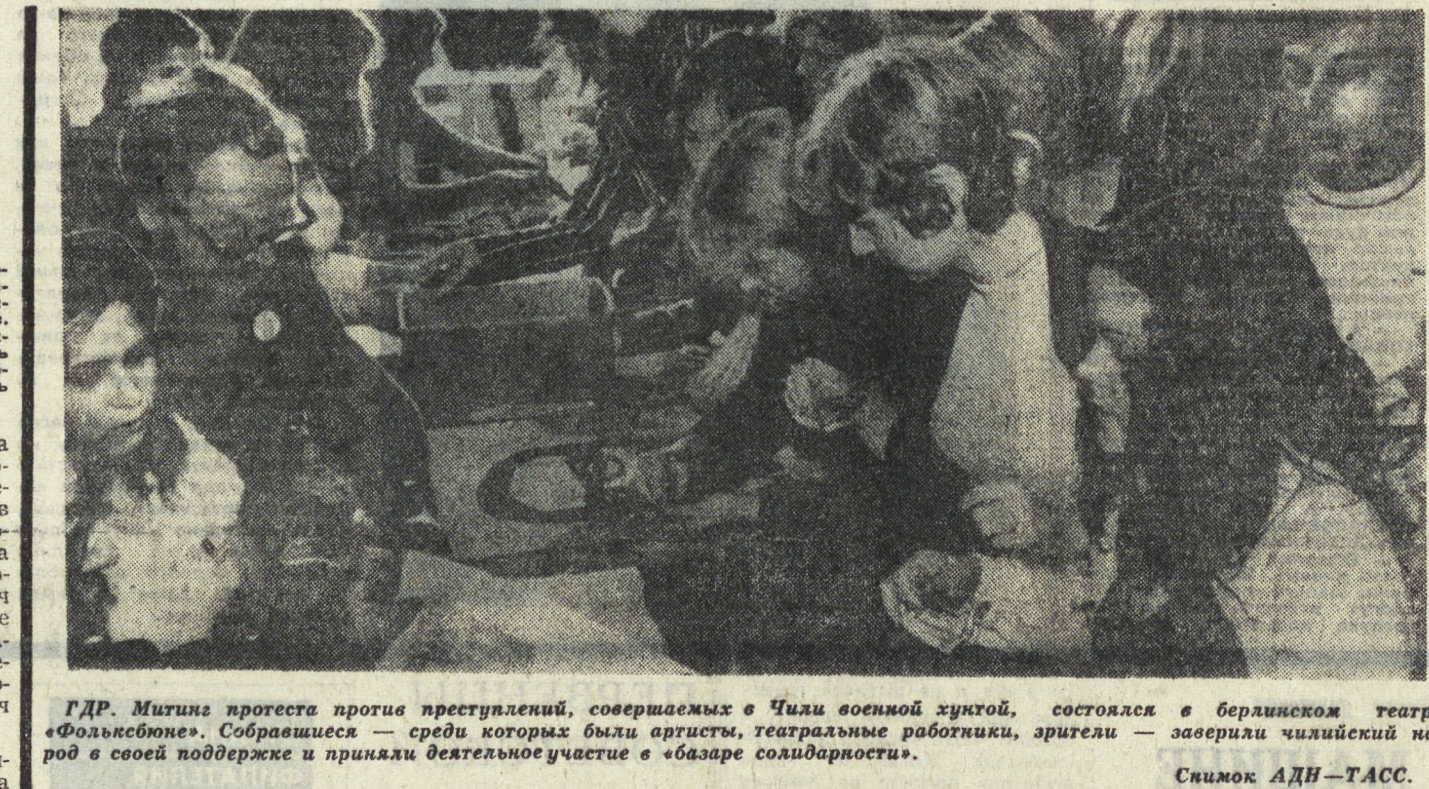
ГДР. Митинг протеста против арестованных, совершаемых в Чили военных хунт, состоялся в берлинском театре «Фольксбюне». Собиравшиеся — среди которых были артисты, театральные работники, зрители — заверили чилийский народ в своей поддержке и приняли деятельное участие в «базаре солидарности».

И не случайно выступления южно-вьетнамцев в защиту своих прав принимают все более яркую форму политической борьбы.