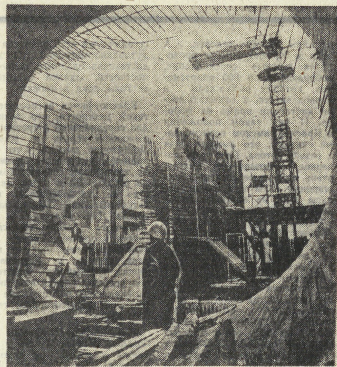
ГДР. Нынешняя пятилетка планирует дальнейшее улучшение энергетического баланса республики. К концу текущего года даст ток первая очередь сооружаемой на севере атомной электростан