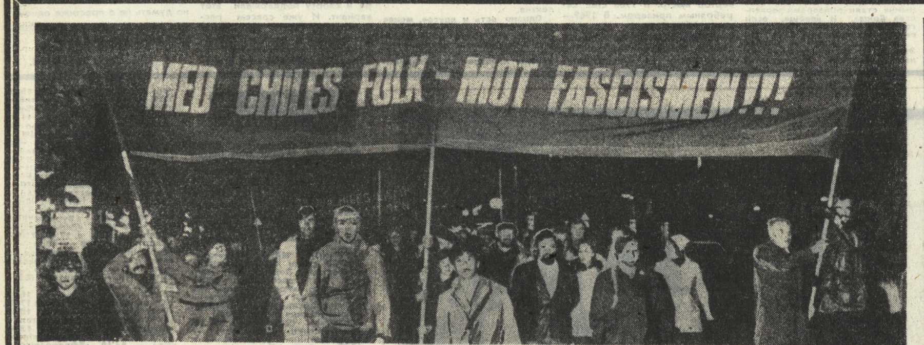
Мировая общественность гневно осуждает действия чилийской реакции, направленные на подавление демократии и свободы в стране. Многочисленная демонстрация солидарности с народом Чили состоялась в Стокгольме. Жители столицы Швеции выжили на улицах лозунгом: «С народом Чили — против фашизма!» На снимке: демонстранты на улицах Стокгольма.

В. ГЕОРИЕВ, к. п. н., к. п. н., корр. АПН.