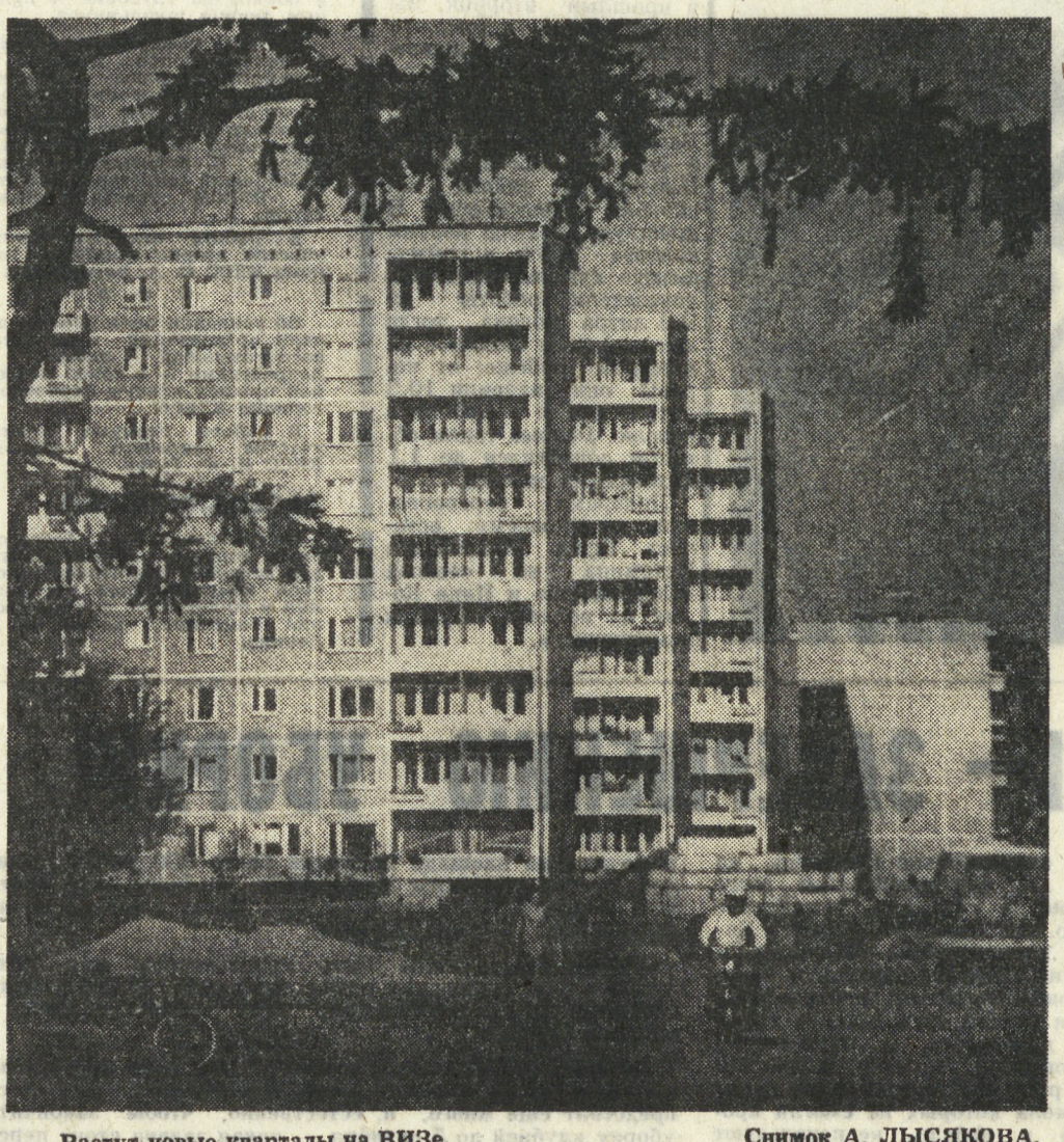
Растут новые кварталы на ВИЗе.

строенного колхозом для нас, городских помощников. Знамя уличной вынестии — приказал военрук Чирьев и крикнул охрипшим голосом: «На знамя равняйся! К памятнику погибшим воинам деревни Бородулино! На торжественную линейку! Поотрядной Шагом марш!»