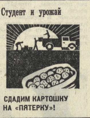
Студент и урожай

В соответствии с программой исследований в околоземном космическом пространстве 27 сентября 1973 года в 15 часов 18 минут по московскому времени в Советском Союзе осуществлен запуск космического корабля «Союз-12». Космический корабль, выведенный на расчетную орбиту спутника Земли, пилотирует экипаж в составе командира корабля подполковника Лазарева Василия Григорьевича и борт-инженера Макарова Олега Григорьевича. Программа орбитального полета, рассчитанного на двое суток, включает: — комплексную проверку и испытание усовершенствованных бортовых систем; — дальнейшую отработку процессов ручного и автоматического управления в различных режимах полета; — проведение спектрографирования отдельных участков земной поверхности с целью получения данных для решения народнохозяйственных задач. Экспериментальный полет корабля «Союз-12» является одним из этапов работ по дальнейшему совершенствованию космических пилотируемых кораблей. С экипажем корабля «Союз-12» поддерживается устойчивая радио-и телевизионная связь. Самочувствие космонавтов товарищей Лазарева и Макарова хорошее, бортовые системы работают нормально. Космонавты товарищи Лазарева и Макарова приступили к выполнению намеченной программы полета.