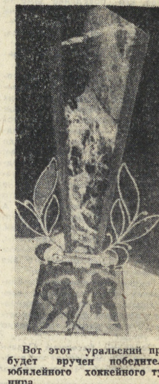
Вот этот уральский приз будет вручен победителю юбилейного хоккейного турнира.