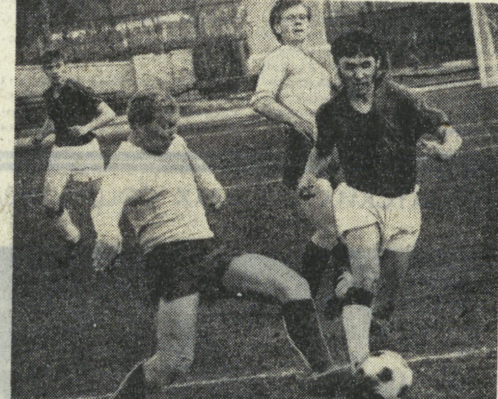
Положение команд перед финальными играми

В минувшем туре первенства в пятую зону второй лиги класса «А» в трех матчах командам приходилось прибегать к серии пенальти для определения победителя. В двух встречах в течение основного времени счет не был открыт: «Торпедо» (Тольятти) — «Волга» (Ульяновск) и «Строитель» (Уфа) — «Химик» (Дзержинск). В первой паре победа досталась хозяевам поля, футболистам Тольятти — 5:4, а во второй — гостям, спортсменам из Дзержинска — 6:5. В Оренбурге «Локомотив» принимал «Энергию» из Чебоксар. В основное время команды обменялись голами, а в серии пен-