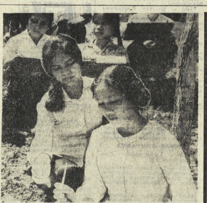
О БОЛЬШОМ ВНИМАНИИ, КОТОРОЕ УДЕЛЯЕТСЯ В ДРВ ДЕ-ТАЛЯ, СВИДЕТЕЛЬСТВУЕТ ФАКТ, ЧТО НА ДАВНО ОТКРЫТЫХ ШКОЛАХ, ГДЕ ОБУЧАЕТСЯ 270 БУДУЩИХ ВОСПИТАТЕЛЕЙ ДЛЯ ДЕТСКИХ САДОВ, ЯСЛЕЙ И НАЧАЛЬНЫХ КЛАССОВ ШКОЛ. НА СНИМКЕ: УРОК ЖИВОПИСИ. БУДУЩИЙ ВОСПИТАТЕЛЬ ДОЛЖЕН ОБЯЗАТЕЛЬНО УМЕТЬ РИСОВАТЬ.