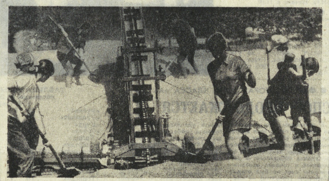
У болгарских студентов и школьниц старших классов в Загаре трудовой семестр. Их летними «аудиториями» сейчас являются многочисленные промышленные стройки и лесные хозяйства, участки госхозов и колхозных хозяйств. Большую работу молодежь проводит по благоустройству городов и сел, по дорожному строительству и сооружению оросительных систем. На снимке: комсомольско-молодежная бригада имени Олега Кошевого помогает оросителям села Берегово Видинского округа.