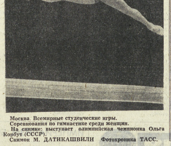
Москва. Всемирные студенческие игры. Соревнования по гимнастике среди женщин. На снимке: выступает олимпийская чемпионка Ольга Корбут (СССР).

ГИМНАСТИКА Впервые на Универсиаде разыграны финалы в отдельных видах гимнастического многоборья у женщин победили: Корбут — на брусьях, бревне и в вольных упражнениях, Богданова — в опорных прыжках. У мужчин: Андрианов — на коне и в вольных упражнениях, Шунин — на брусьях, Лебедев — в опорном прыжке, Грекуй был первым на кольцах, а кубинец Куэвро — в опорном прыжке.