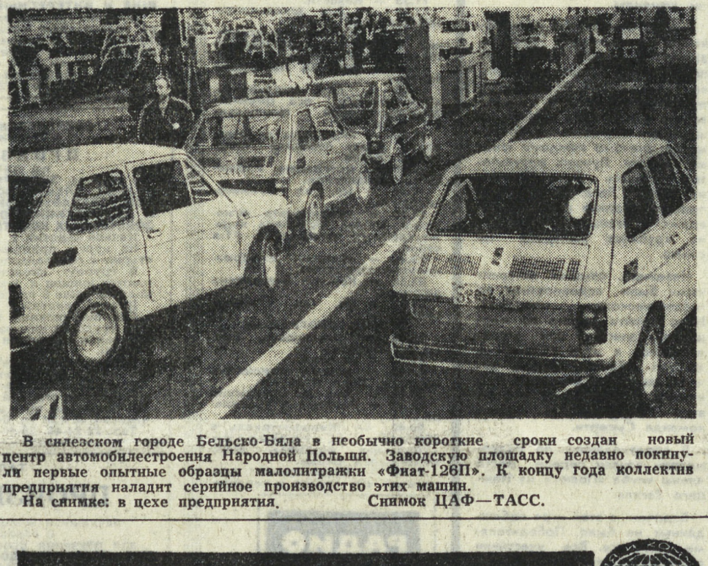
В слесарском городе Бельско-Бяла в необычно короткие сроки создан новый центр автомобилестроения Народной Польши. Заводскую площадку недавно покинули первые опытные образцы малолитражки «Фиат-126В». К концу года коллектив предприятия наладит серийное производство этих машин. На снимке: в цехе предприятия. Снимок ЦАФ—ТАСС.

В БРАТСКИХ СТРАНАХ СОЦИАЛИЗМА ПОМОЩЬ МОЛОДЫМ ГОСУДАРСТВАМ СОФИЯ. (Соб. корр. АПН). За последние 13 лет товарооборот Болгарии с развивающимися странами вырос в 8 раз, его стоимостное выражение превышает ныне 316 миллионов левов. НРБ предоставляет, например, арабским государствам кредиты на сумму свыше 400 миллионов долларов, предназначенные главным образом на строительство комплексов объектов. Кредиты погашаются поставками готовой продукции или полуфабрикатов, которые выпускают предприятия, построенные с участием Болгарии.