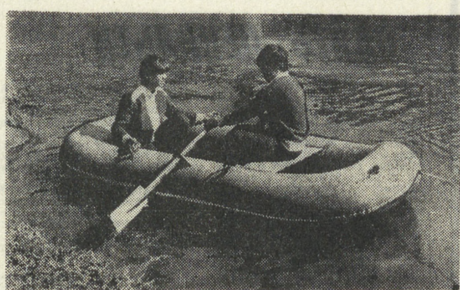
Вот такие резиновые лодки начал выпускать Свердловский завод клиновых ремней...