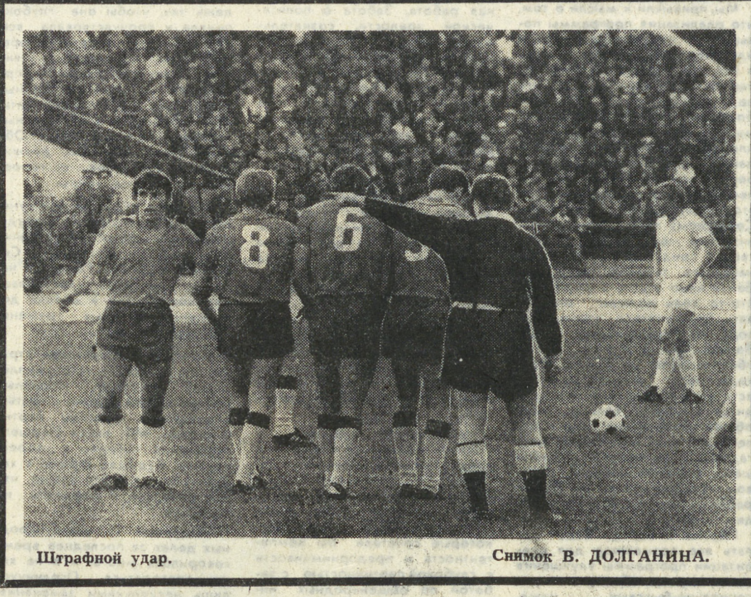
Штрафной удар.