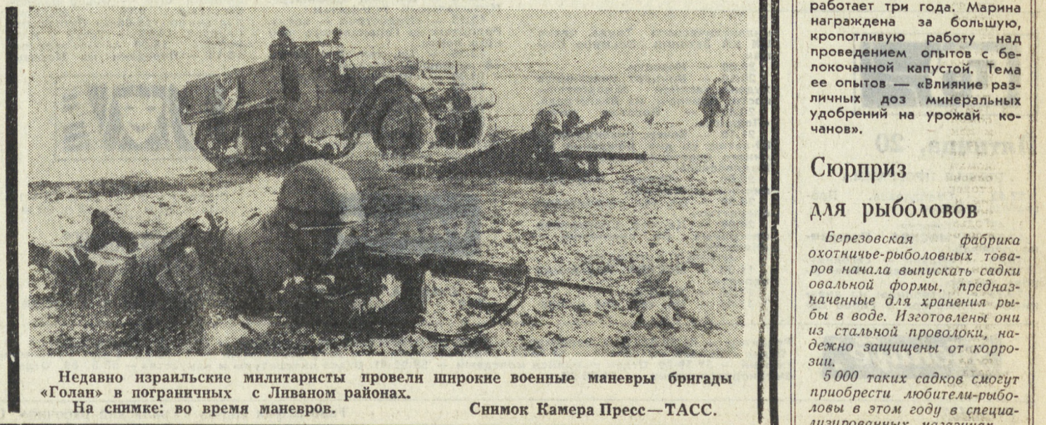
Недавно израильские милиционеры провели широкие военные маневры бригады «Голан» в пограничных с Ливаном районах. На снимке: во время маневров.