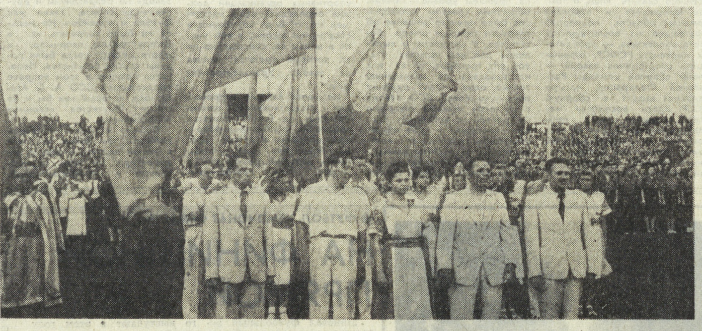
На снимке: так было на первом молодежном форуме в Праге (1947).