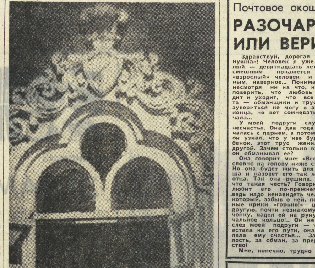
Хорошее настроение.

— Баба Мотя, — кричит он уже с улицы, — ты завтра жди, я снова придю!