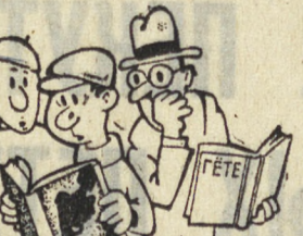
Рис. С. АШМАРИНА.

— Ты все «В объятиях носорога» читаешь? — Скажешь... Уже за новую взялся — «Встреча с динозавром» называется. — А я читаю «Зуб акулы», «Захватывающая штука!» — Читал... Мне вот обещали «Хвосты доктора Полотенцева». О выключатель и лейтенанте Ухова. — А ты смотришь по телевизору «Шучки Антилопы»? — Семнадцатую серию пропустил... Чем вчера закончилось? — Да этим... Выключено трубу у здания... — Ого!.