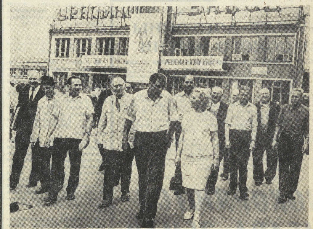
Идет трудовая гордость Уралмаша — представители рабочих династий.

15 июля исполняется 40 лет Уралскому заводу тяжелого машиностроения имени Серго Орджоникидзе