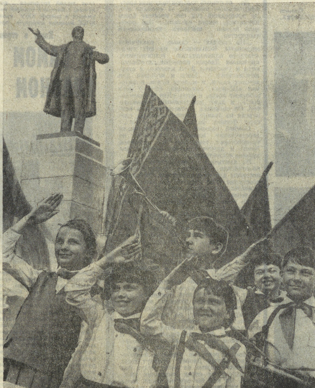
Фотоплакат Л. БАРАНОВА.

Сегодня — день рождения Всесоюзной пионерской организации имени В. И. Ленина