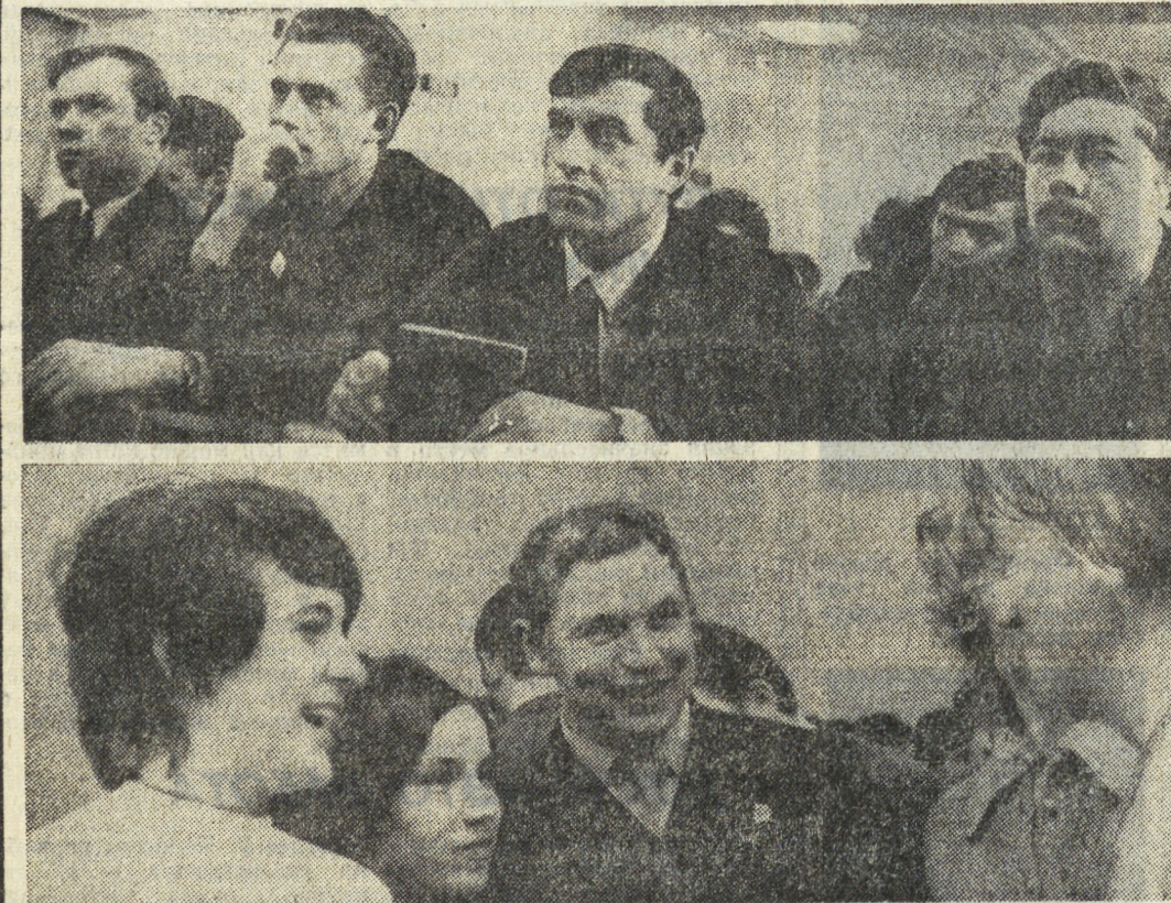
На снимках Л. Баранова: участники пленума в зале заседаний обкома ВЛКСМ (вверху); в переерье всегда найдется о чем поговорить (снизу).