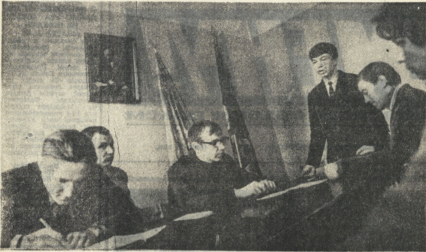
ПОЗЫВНЫЕ РЕКОНСТРУКЦИИ: ИНИЦИАТИВА, НОВАТОРСТВО, РАСЧЕТ, ДЕРЗАНИЕ

КАКОЕ значение имеет на любом заводе котельная, говорить не приходится. Без пара, без тепла, которое она дает, работать невозможно.