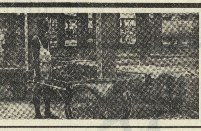
На снимке: занзибарские рабочие на строительстве сахарного завода в городе Мурухуби.