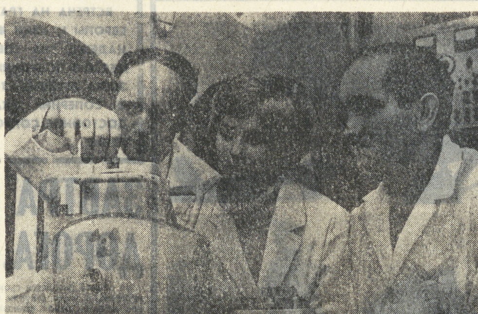
В народном хозяйстве Польши широко используются радиоактивные изотопы. Их применение ускоряет технический прогресс, облегчает труд людей, дает большой экологический эффект. Польские изотопные установки и приборы экспортируются в социалистические страны, а также в ряд капиталистических государств. На снимке в ряд капиталистических государств. На снимке в ряд капиталистических государств. На снимке в ряд капиталистических государств.

плодотворно развивается сотрудничество между вузами ГДР и других социалистических стран, в частности Польши и ЧССР. В основе его лежат также взаимные обязательства, закрепленные в договорах о дружбе. (ТАСС).