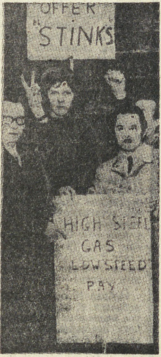
АНГЛИЯ. Трудящиеся страны отвергают экономическую политику консерваторов и твердо заявляют, что они будут бороться против намерений правительства понизить с инфляцией за счет интересов рабочих.

В ЧУЖОЙ стране поначалу на каждом шагу — необычное. Потом ко многому привыкаешь, причем неожиданно быстро — даже в Америке. В первый вечер нас, помню, буквально огулила нью-йоркская улица. Идешь — и такое впечатление, будто стоишь у ужасной шум. Между тем никакого особого шума нет, это эффект световой рекламы — неизмеримо яркой, пестрой, бегущей, спорящей... Но мы как-то перестали обращать на нее внимание уже на третий день. И перестали прожечь глазами роскошные «олдсмобили», «кадиллаки», «форды» — освоенные. Встречается однако такое, к чему не знаешь даже как отнестись.