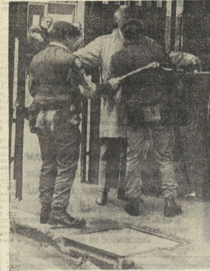
Столица Северной Ирландии Белфаст производит сейчас впечатление оккупированного города. У вокзалов и автобусных станций, на площадях и улицах, в рабочих кварталах и деловых районах — усиленные патрули английских солдат. В городе продолжают облавы, обыски и аресты, вспыхивают перестрелки. На снимке: обыск жителей на одном из контрольно-пропускных пунктов столицы.