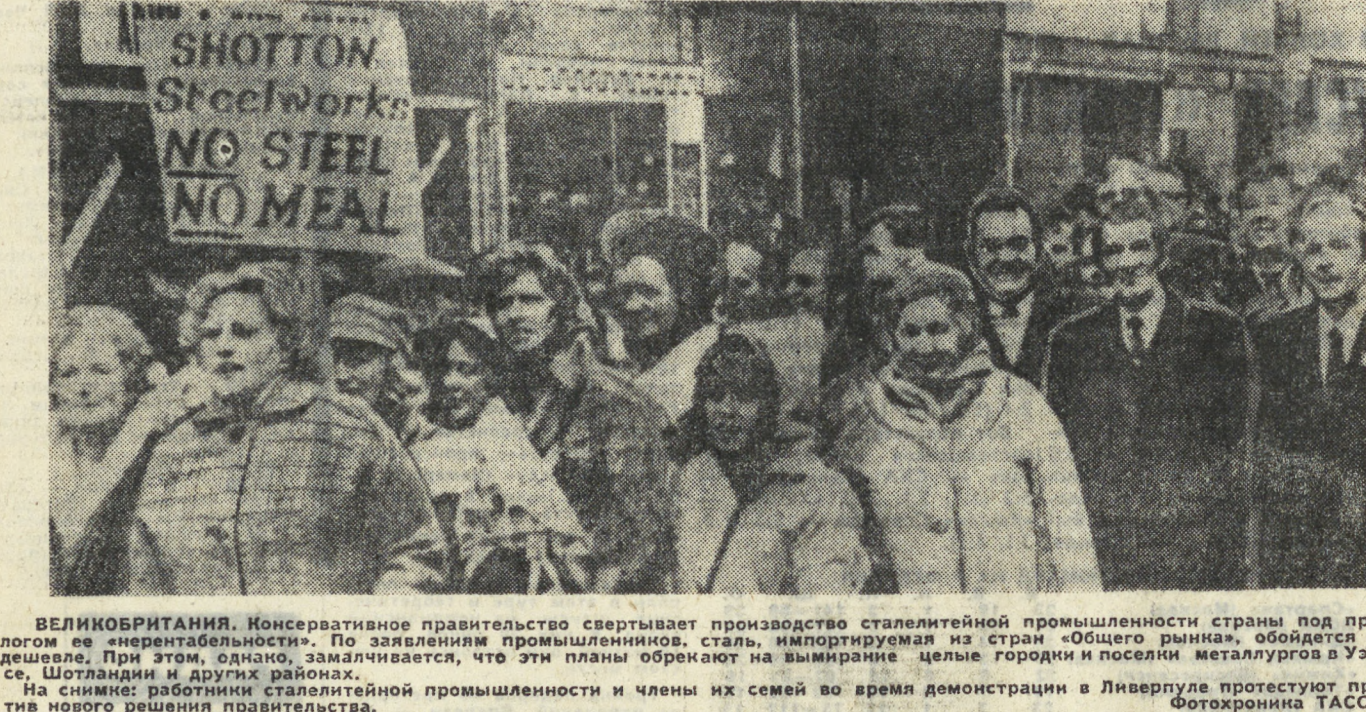
ВЕЛИКОБРИТАНИЯ. Консервативное правительство свертывает производство стальной промышленности страны под предлогом «неэкономичности»...