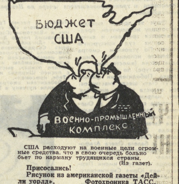
США расходуют на военные цели огромные средства. Так в свою очередь и они обходят по сравнению с военными бюджетами других стран.