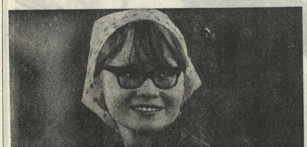
На этих снимках — девушки-комсомолки пошивочного цеха Свердловской фабрики «Спортобувь».