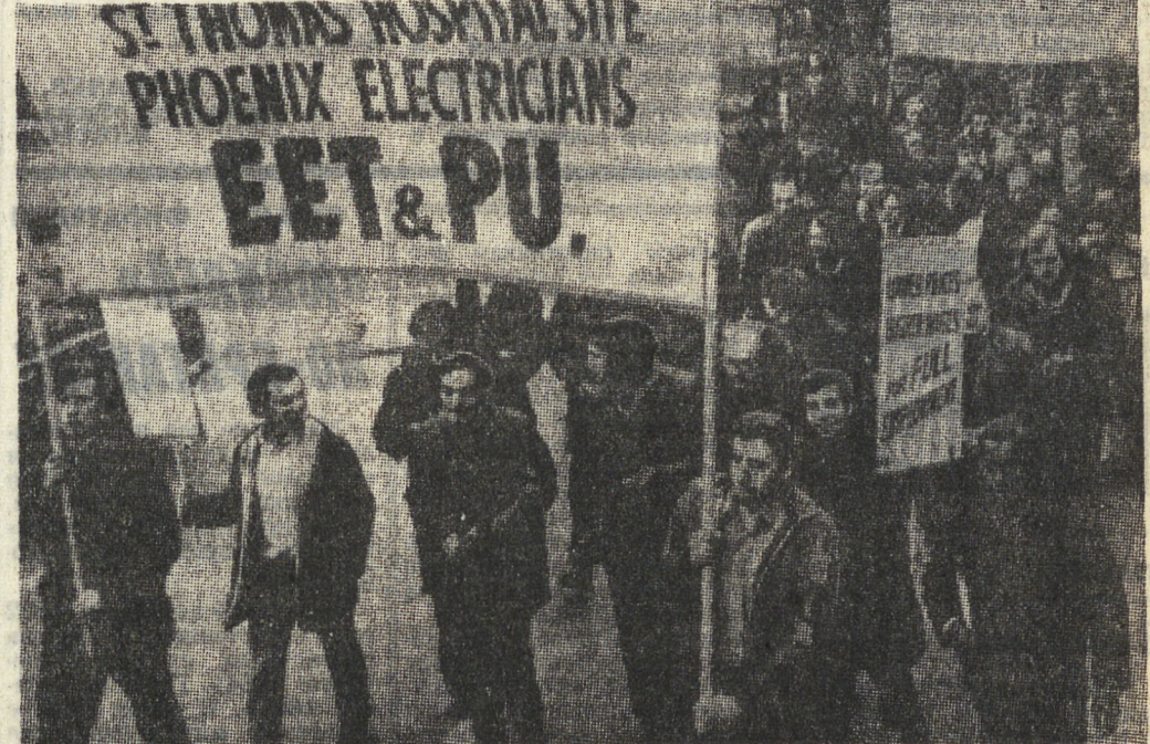
Трудящиеся Англии продолжают борьбу против наступления монополий на свои жизненные права, против антирабочего закона «об отношениях в промышленности». На снимке: демонстрация работников коммунального хозяйства в одном из районов Лондона.