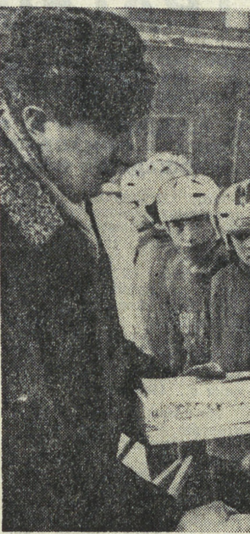
призы вручает олимпийский чемпион В. Г. Шувалов; на льду «Спартаковца».