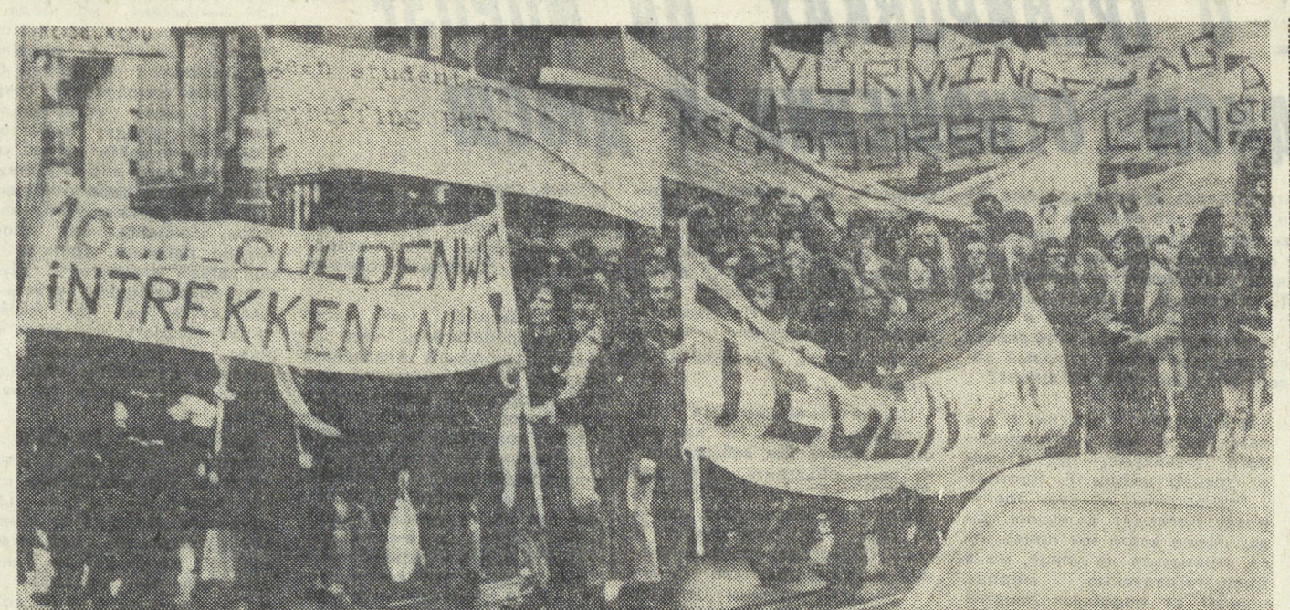
АМСТЕРДАМ. Студенческая молодежь Голландии решительно выступает против закона правительства о повышении платы за образование.

Свердловская швейная фирма имени Крупской освоила выпуск нескольких новых моделей женской одежды. Женские платья из шерсти классического силуэта и нарядные шелковые платья обязательно понравятся свердловчанам.