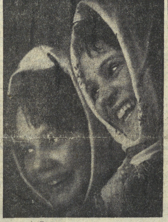
Фотоплакат А. Лыскова.