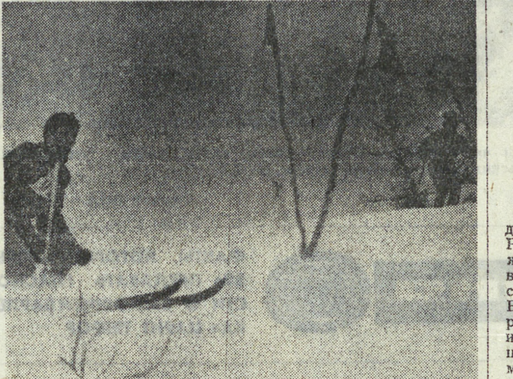
Лыжи — один из самых популярных видов спорта в нашей области. Наверное, не проходит дня без соревнований на лыжне. Но и без них любители прогулок не скушают. В выходные дни за город электричками и поездами, автобусами и троллейбусами уезжают тысячи свердловчан, чтобы покатаются на лыжах, попить на свежем воздухе, закалить свое здоровье.

Недостаток мастерства и опыта гости компенсировали самоотверженной и жесткой игрой, порой на грани фола. Атаки их были незамысловатыми, но в разрушении линии атак они преуспели. Вот потому матч, состоявшийся на Центральном стадионе, был зрелищно малоприятным. Он походил на экзамен по реализации стандартных положений. В этом особенно отличились армейцы.