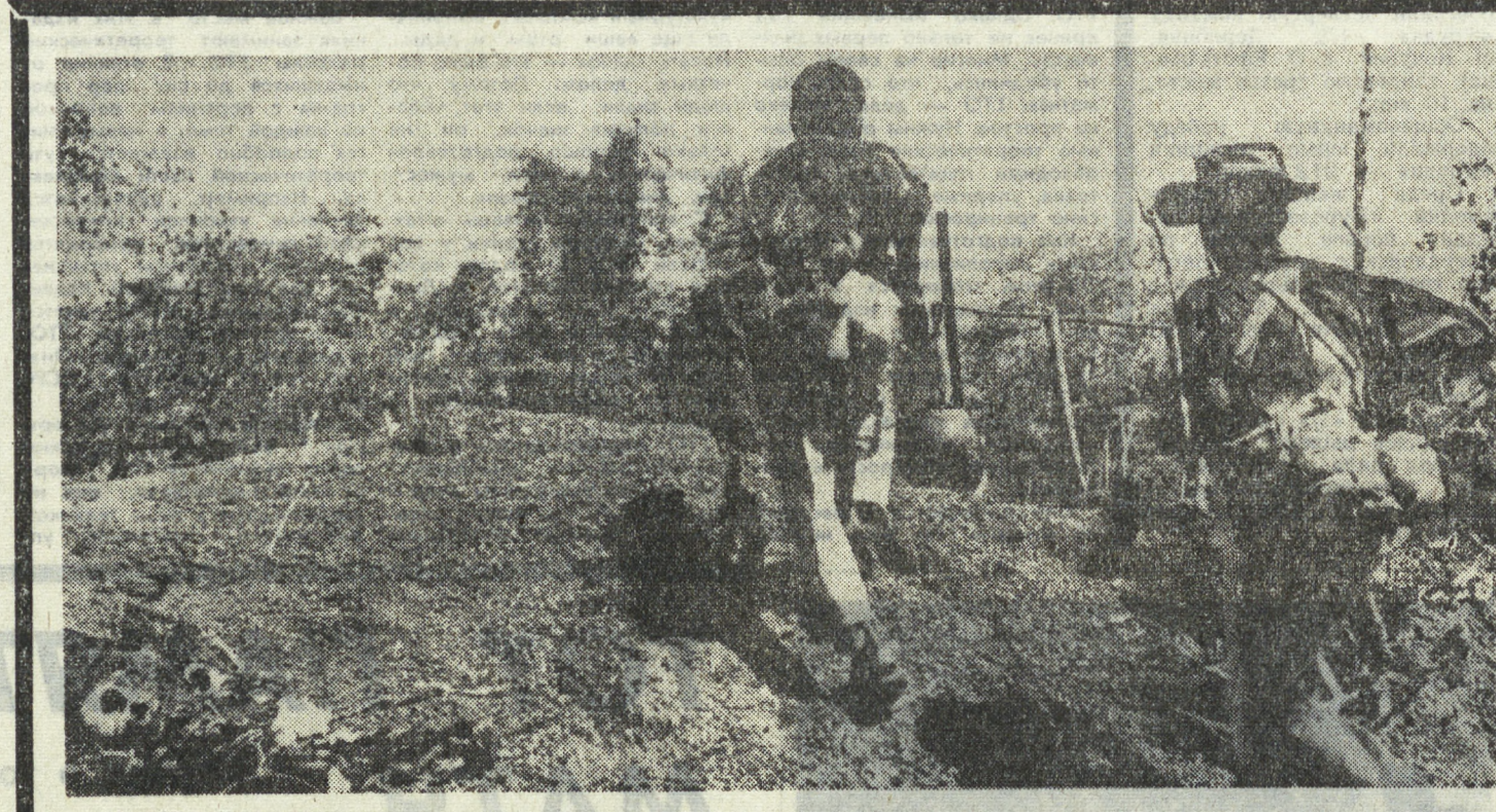
КАМВОДЖА. Упорные бои продолжаются в южной части страны. Патриотические силы своими успешными действиями сковали значительную группировку племенных войск в районе дороги № 2. На снимке: атакуют камбоджийские патриоты.