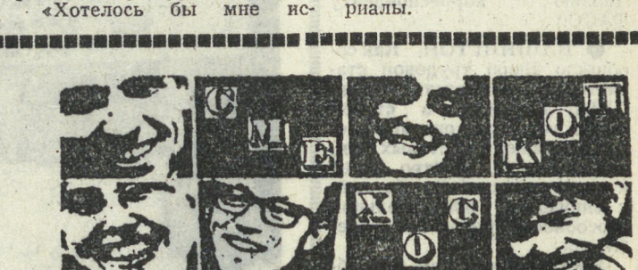
АМИЛИЯ моя Сатиркин. Шутить я начал еще будучи студентом первого курса политического института. Это свое хобби я мужественно пронес через все пять лет учебы и явился с ним на работу, в конструкторское бюро. И вот однажды сижу я себе этак спокойно, как вдруг вызывает меня шеф.