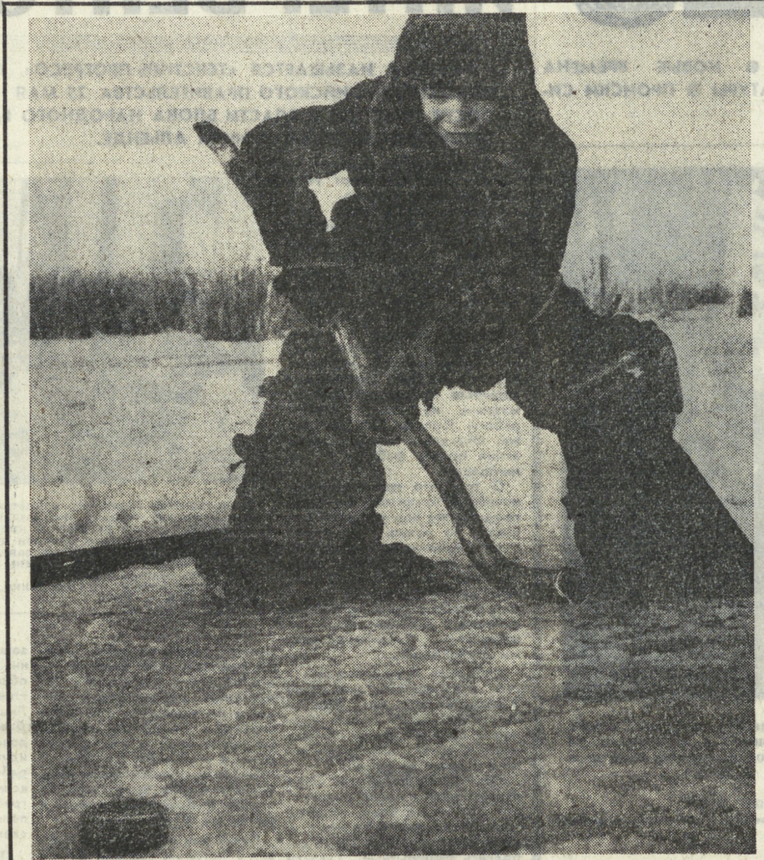
Юный сельский вратарь.

Новая постановка пришла по душе зрителям города. А недавно работу самодеятельного драматического коллектива посмотрели труженники Бродовского совхоза. Спектакль на сцене села Мартюш был встречен тепло.