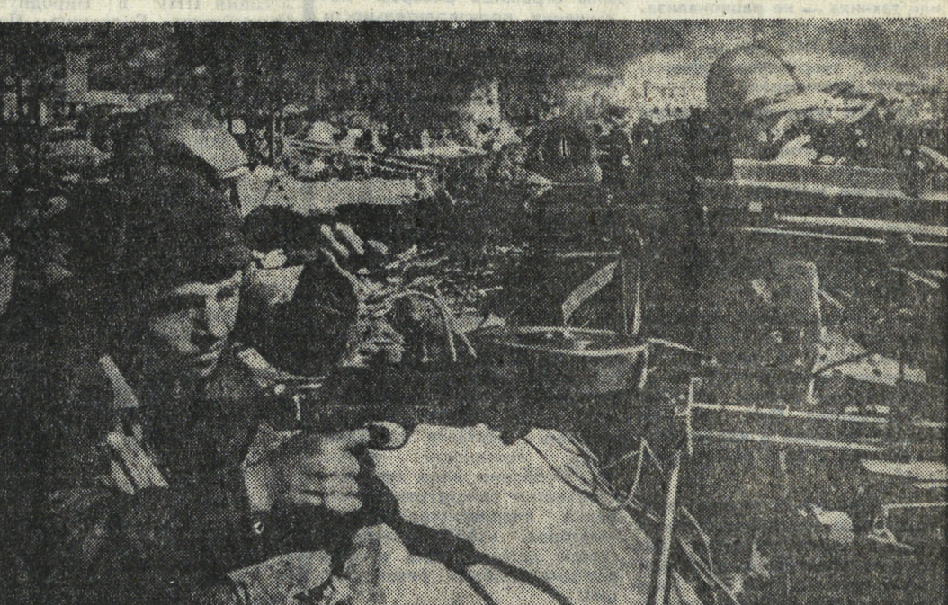
Почти 70 суток не прекращались оборонительные бои в Сталинграде. Борьба шла за каждый метр земли, за каждый дом, за каждый подвал.