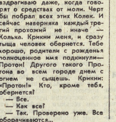
Рис. С. АШМАРИНА.