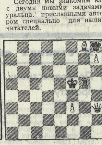
№ 181. А. МАКСИМОВСКИХ. Мат в 3 хода. (2 очка)

высокие отличия на крупных конкурсах. Сегодня мы знакомим вас с двумя новыми задачами уральца, присланными автором специально для наших читателей.