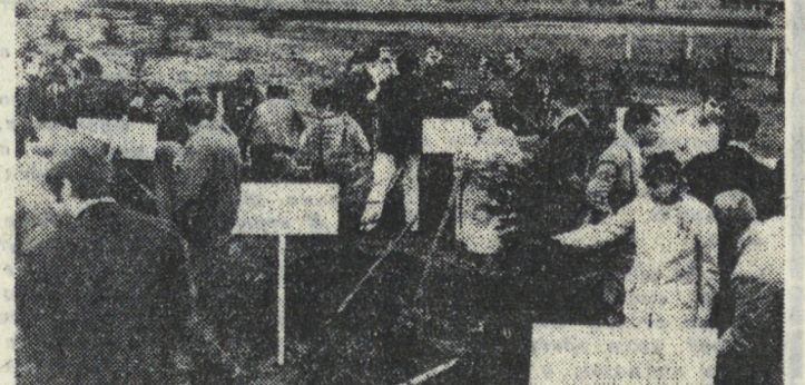
На снимке: участники встречи сажают деревья в «Аллею дружбы» студенческого городка.