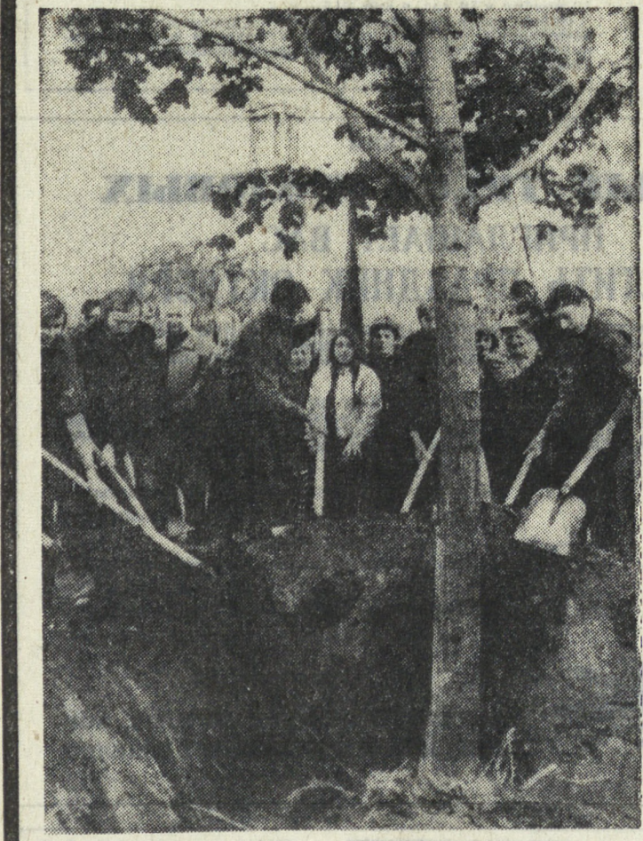
БЕРЛИН. Первый субботний, посвященный X Всемирному фестивалю молодежи и студентов, состоялся в столице ГДР. 90 тысяч берлинцев по призыву Союза свободной немецкой молодежи благодарили в этот день территорию фестивального парка, который раскинется в центре города между будущей и набережной Шпрее. Первым деревом будущего зеленого оазиса стал этот илан (на снимке).