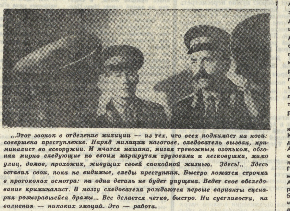
«Этот звонок в отделение милиции — из тех, что всех поднимают на ноги: совершено преступление. Наряд милиции наготове, следователь вызван, криминалист во всеоружии. И жидится машина, жидя тревожащим огоньком, обгоняя жирно следующие по своим маршрутам грузовики и легковушки, жидя улицы, дождь, прохожих, живущих своей спокойной жизнью. Звесь... Звесь оставил свои, пока не видны, следы преступника. Быстро ложится строчка в протокол: осмотра: ни одна деталь не будет упущена. Ведет свое обледование криминалист. В мозгу следователя рождаются первые варианты сценария разгромившейся драмы... Все делается четко, быстро. Ни суетливости, ни околения — никаких эмоций. Это — работа.

Сколько их, трудных и головоломных задач, приходится решать! Нет, не лихтертовские ильиче — знания и опыт позволяют работникам милиции. Учиться приходится всю жизнь. Не знаящая в училище, в повседневном общении со старшими, умудренными жизнью товарищами и, конечно, на месте преступления... Такова профессия.