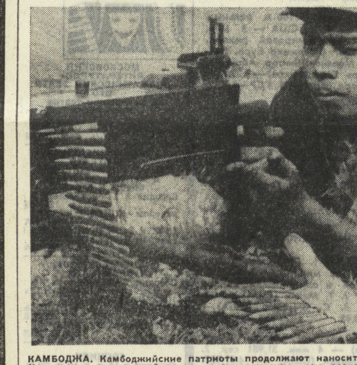
КАМБОДЖА. Камбоджийские патриоты продолжают наносить удары по южноамериканским войскам, которые несут большие потери. На снимке: пулеметный расчет патриотических сил ведет огонь по противнику.

помощи для преодоления проблемы адаптации. Это не значит, что каждый второй ветеран уже сошел с ума, но это значит, что очень много юношей возвращаются опустошенными, апатичными, потерявшими интерес к жизни. — Я ненавижу себя, ветерана-наемника, убийцу, — говорит один. Многие продолжают принимать наркотики, к которым они привыкли еще во Вьетнаме. Надомленными, потерянными, озлобленными возвращаются в американское общество солдаты, затягивающие себя участием в грязной войне. Г. ГЕРАСИМОВ, соб. корр. АПН.