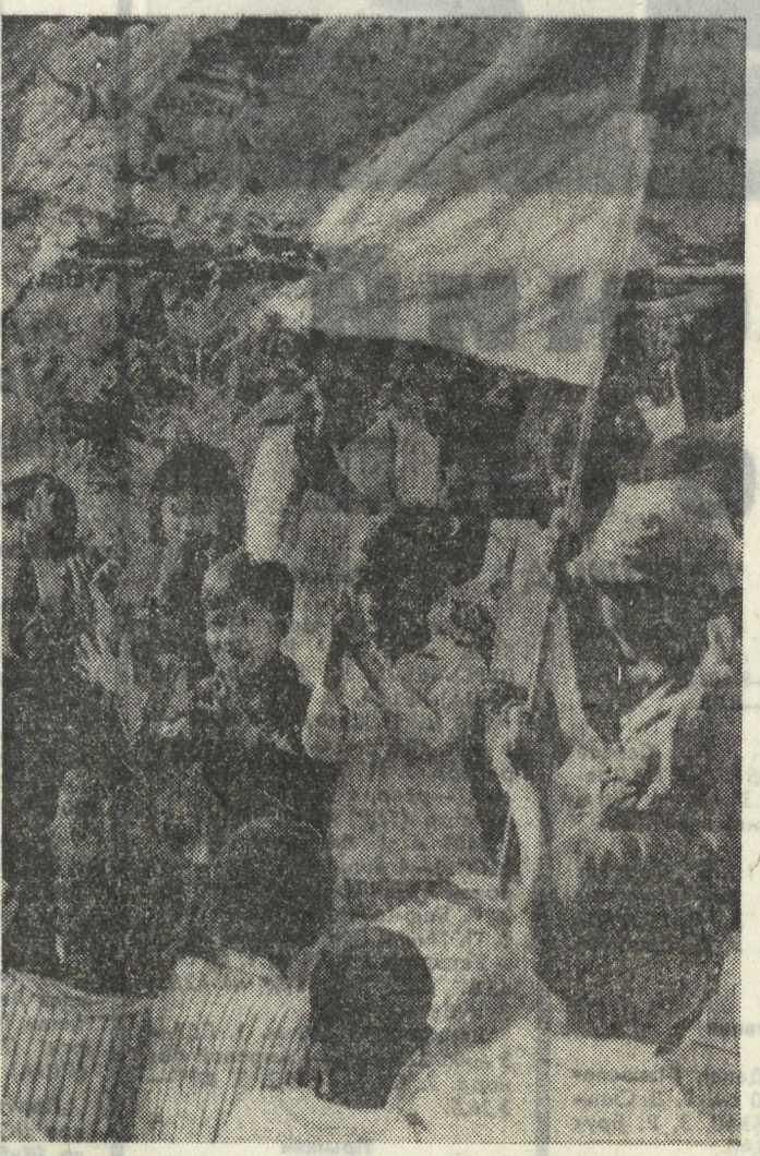
ЮЖНЫЙ ВЬЕТНАМ. Патриоты НВСО, ведя упорные бои с оборонными частями сайгонских войск, освободили значительную территорию в провинциях Плейку и Контум. В освобожденных районах проводится мероприятия по созданию нормальных условий для жизни населения.