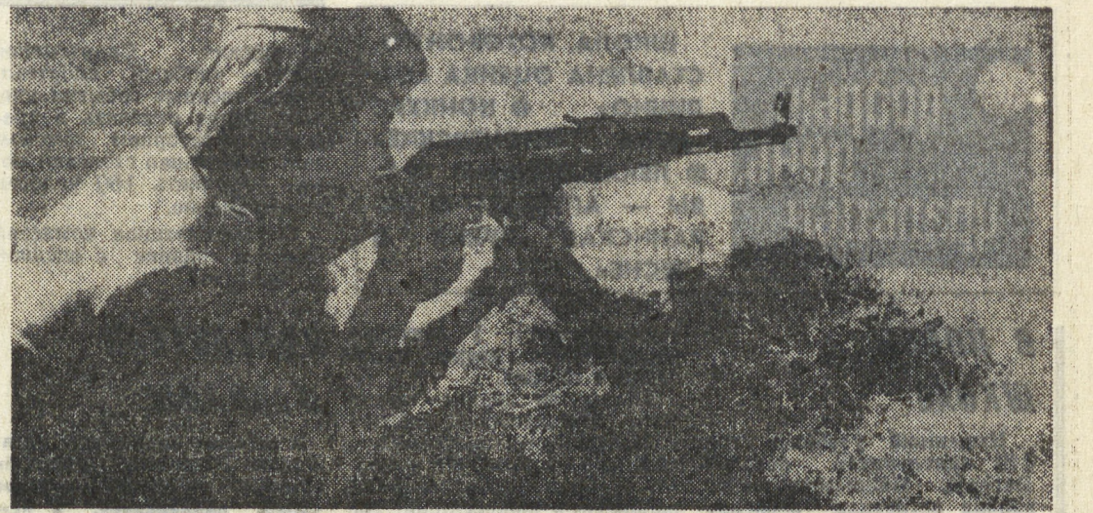
Дробью рассыпаются автоматные очереди...

В соответствии с программой по начальной подготовке к службе в рядах Советской Армии на Уралавтозаводе проводится большая работа среди молодежи. На учебном пункте с 10 августа организованы занятия допризывников. Будущие воины изучают уставы, проходят тактическую подготовку, осваивают боевое оружие. Важное место отведено сдаче физкультурного комплекса новых норм ГТО. Все ребята, занимающиеся в учебном пункте, успешно штурмовали рубе-