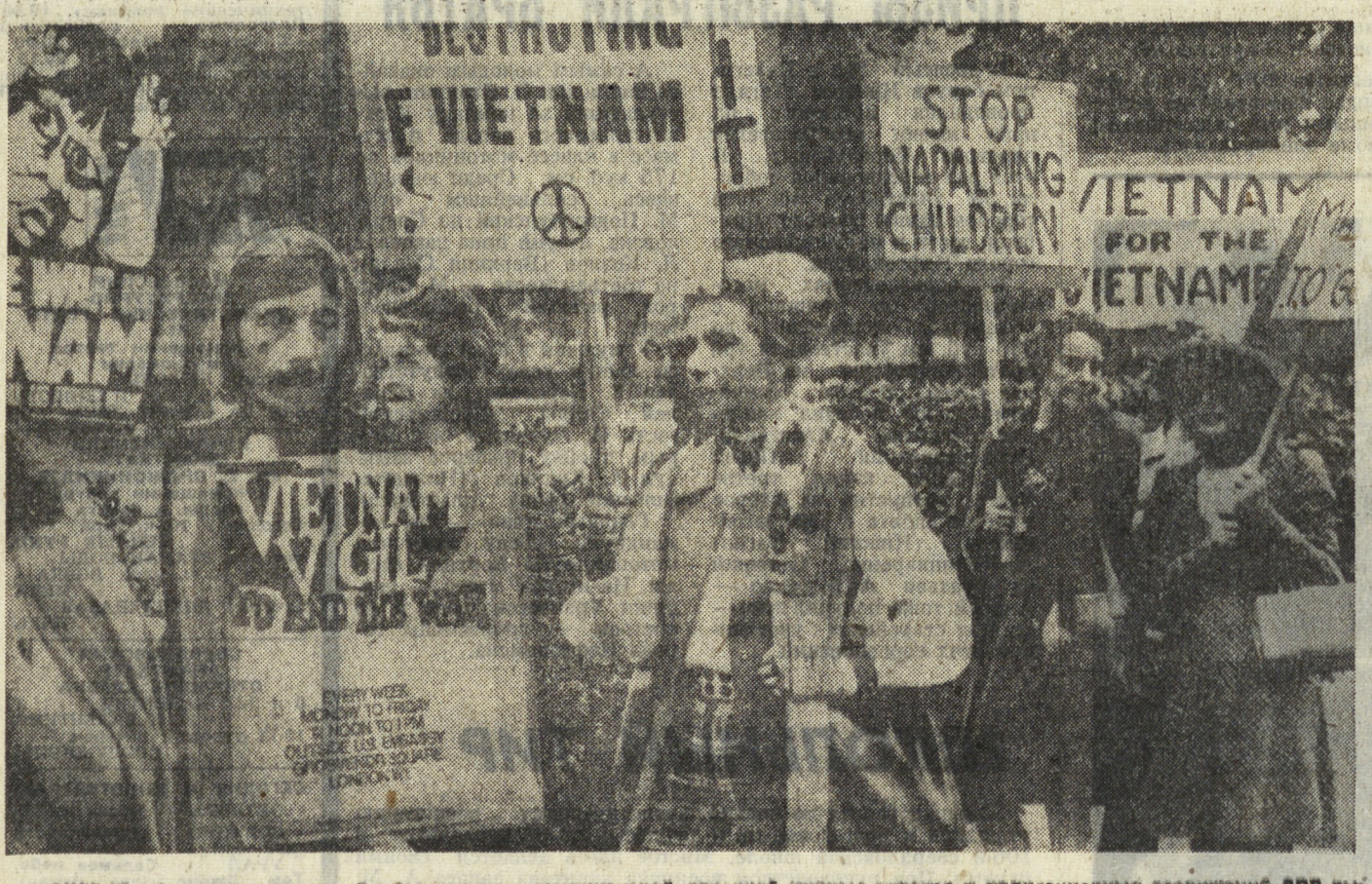
АНГЛИЯ. Продолжающиеся бомбардировки американской авиацией мирных городов и ирригационных сооружений ДРВ вызывают растущие протесты общественности страны. «Немедленно прекратите войну во Вьетнаме!», «Остановите истребление детей напалом!» — «Вьетнам — вьетнамцам!» — под такими лозунгами в английской столице, у здания американского посольства, проходят еженедельные демонстрации протеста против агрессии США во Вьетнаме. В них принимают участие самые различные слои населения: рабочие и служащие, представители интеллигенции, студенты и домохозяйки.

МИНИСТР БЕЖАЛ БЫСТРЕЕ ЛАНИ... ● ШТРАФ... ЗА СВОБОДНОЕ СЛОВО ● ПО-ПРЕЖНЕМУ БОМБАТ ДАМБЫ ● УЗНИКИ ПАРАГВАЙСКИХ ТЮРЕМ