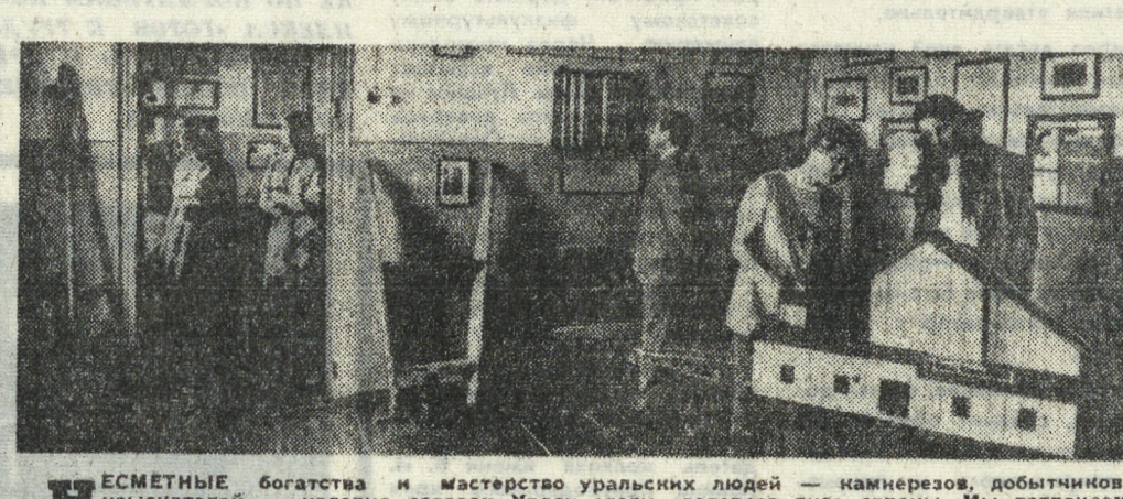
БЕСМЕРТНЫЕ богатства и мастерство уральских людей — каменерезов, добытчиков, ювелиров — издавна создали Уралу славу «золотого дна» страны.

Успешно завершилась историко-бытовая экспедиция Свердловского областного краеведческого музея в Верхотурский район.