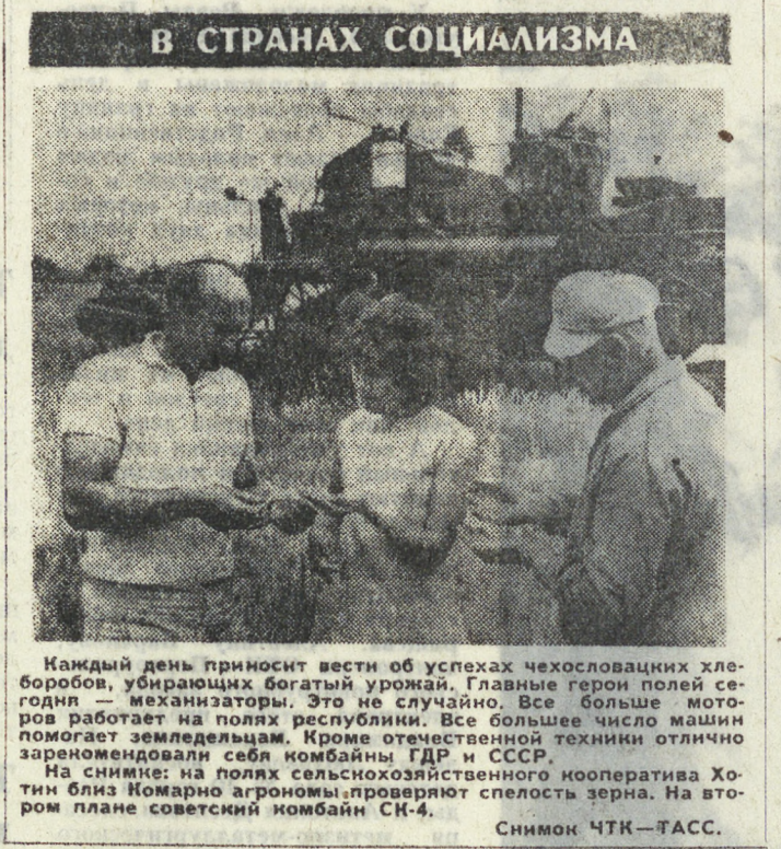
Каждый день приносит вести об успехах чехословацких хлеборобов, убирающих богатый урожай. Главные герои почти каждого рабочего дня в республике. Все большее число машин помогает земледельцам. Кроме отечественной техники отлично зарекомендовали себя комбайны ГДР и СССР. На снимке: на полях сельхозхозяйственного кооператива Хоти близ Комарно агрономы проверяют спелость зерна. На втором плане советский комбайн СК-4.

Конструктивные и реалистические предложения делегаций ДРВ и Временного революционного правительства Республики Южный Вьетнам на парижских переговорах, как отмечается в советской печати, служат основой для прекращения американской агрессии, для мирного решения вьетнамской проблемы и воссоединения страны. Позиция Советского Союза, поддержанная всеми слоями советского общества во время проходящего сейчас месячника солидарности, тверда и ясна: он всегда был и будет на стороне правого дела мужественных патриотов Вьетнама. [АПН].