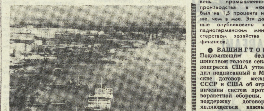
Не прекращаются работы по очистке Читтагонга, крупнейшего порта Народной Республики Бангладеш, пострадавшего во время минувших боев. По просьбе правительства республики советские специалисты оказывают помощь по очистке порта и подъему затонувших судов. В результате проведенных операций по разминированию навалов, ведущих к порту, и подъема судов очищены многие причалы, и Читтагонг вновь возвращается для мирного судоходства. На снимке: работы в порту Читтагонг.

ЦИФРЫ ГОВОРЯТ САМИ ЗА СЕБЯ. Западногерманская газета «Дойче фолксцайтунг» опубликовала несколько красноречивых цифр.