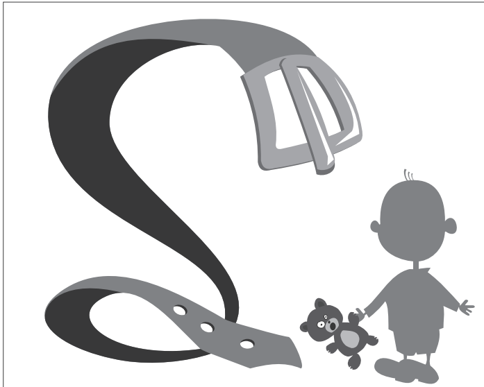
иллюстрация ПЕТРА УПОРОВА.

Самое удивительное выяснилось позже – молодая женщина недоумевала: какие могут быть к ней замечания? Она ведь любит своих детей и не собираются от них отказываться. Такие мамочки и не догадываются, что пренебрежение потребностями ребенка, бездействие родителей по отношению к ребенку является одним из видов жестокого обращения с ребенком. Им приходится разъяснять, что пренебрежение – это хроническая неспособность родителя или лица, осуществляющего уход, обеспечить основные потребно-