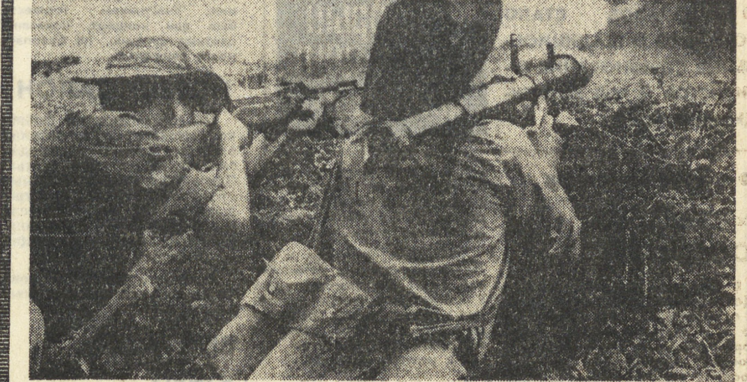
Патриоты НВСО Южного Вьетнама усиливают натиск на противника. Только за одну неделю в провинции Контум было захвачено 600 вражеских солдат. На снимке: бойцы НВСО ведут огонь по укрытиям противника.

ДЕЛИ. Богатые месторождения медной руды, известняка и бокситов обнаружены в индийском штате Уттар Прадеш. Как заявил представитель департамента промышленности Уттар Прадеша, месторождения послужат базой для развития в штате международной, алюминиевой и цементной отраслей промышленности. (ТАСС).