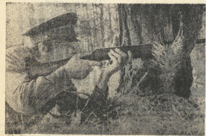
Учить метко стрелять — одна из заповедей будущего воина. И ребята соблюдают ее.