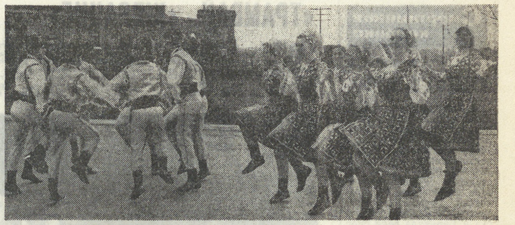
МОЛДАВСКАЯ ССР. ВИАРОНА. Так по-молдавски называется подснежник. Это имя носит один из популярных самодеятельных коллективов республики. В его репертуаре танцы молдавские, украинские, русские... Недавно «ВИАРОНА» получила приглашение в Чехословакию. Это будет ее первая зарубежная поездка. На сцене: болгарский танец в исполнении ансамбля.