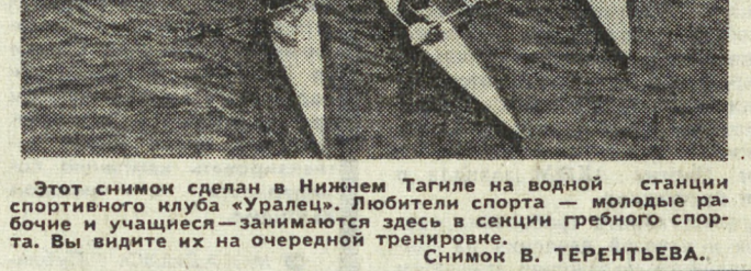
Этот снимок сделан в Нижнем Тагиле на водной станции спортивного клуба «Уралец». Любители спорта — молодые рабочие и учащиеся — занимаются здесь в секции гребного спорта. Вы видите их на очередной тренировке.

Первую победу в сезоне одержал «Строитель», обыгравший на своем поле чимкентский «Металлург» — 1:0 и с последнего места перебравшийся двумя ступеньками выше. Он поменялся местами с «Нефтяником», который вновь про-