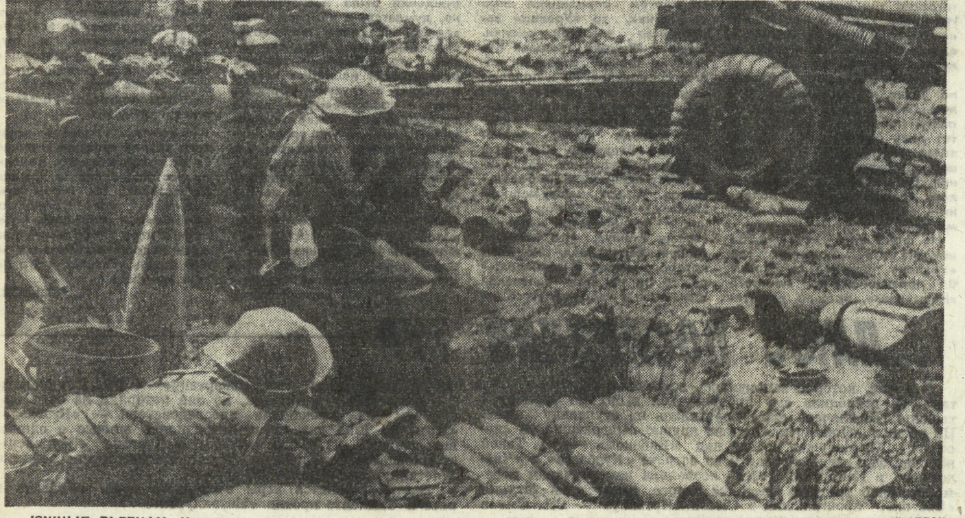
ЮЖНЫЙ ВЬЕТНАМ. Народные вооруженные силы освобожденной Южной Вьетнама продолжают атаковать позиции и укрепленные пункты сайгонских войск.