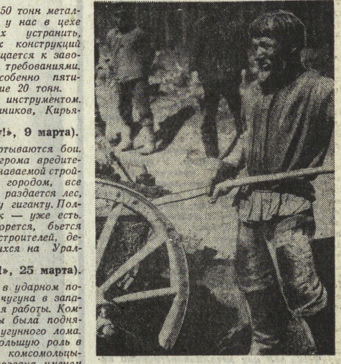
Так начинался Уралмаш.