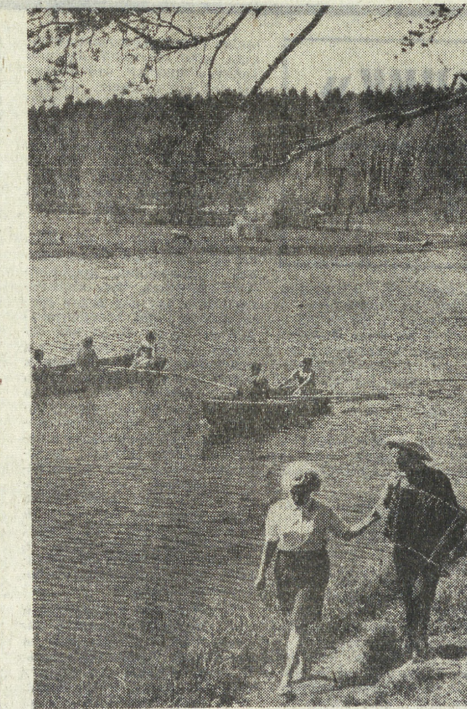
В доме отдыха «Асбест».

Нью-орлеанская полиция лихо разбиралась с человеком, сивающего себе славу «незлостого бандита». Как полагали его жертвы, он бродит ночами по темным закоулкам, подхватит и случайным прохожим и голорит: «Здравствуйте, покаяйтесь. Не будете ли вы столь любезны помочь неизвестному голодающему человеку? Все, что у меня есть на этом свете, только этот пистолет...»