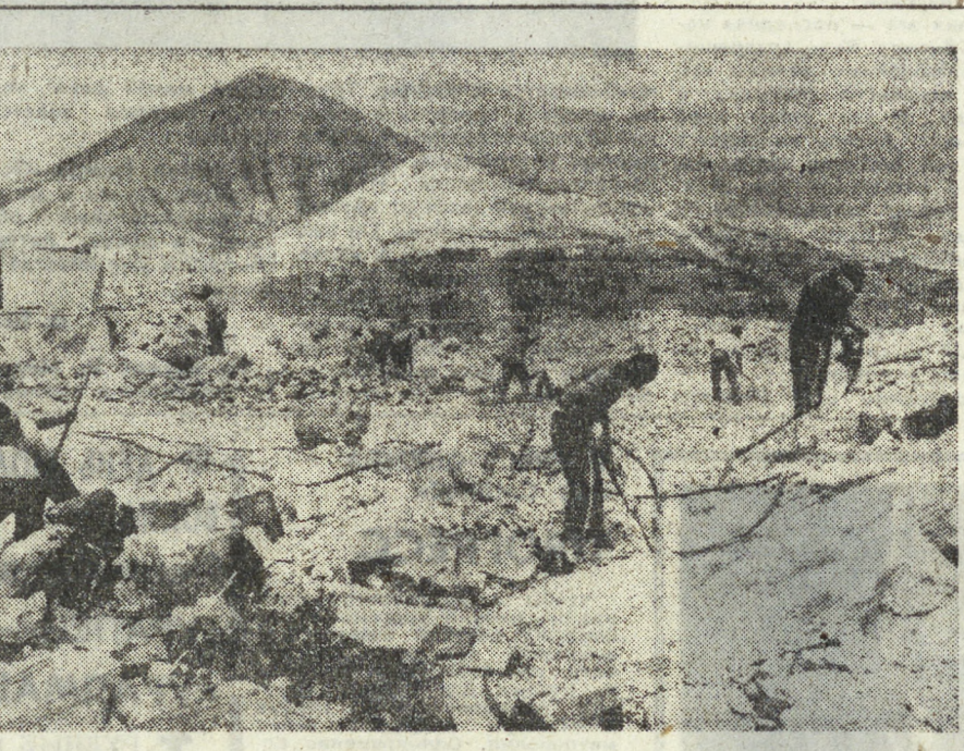
Перу строят новую жизнь. Прогрессивные преобразования, осуществляемые правительствами, пришедшими к власти в октябре 1968 года, уже приносят первые плоды. Наряду с жилищной проблемой решаются задачи снабжения перуанской столицы и ее пригородов доброкачественной питьевой водой. На снимке: строительство водохранилища вблизи Лимы.

получила от них ряд обещаний о предоставлении «крупных денежных сумм, которые естественно будут направлены для борьбы против патриотов Ольстера. Во время визита Крейг встретился с представителями крупного бизнеса и с главами правых организаций и обсудил с ними вопросы о координации деятельности. Таким образом, в момент, когда население Северной Ирландии ведет мужественную борьбу против английского империализма, юнионисты Ольстера и крайне правые элементы стремятся заручиться более активной поддержкой международной реакции, получить от нее больше помощи. Но вряд ли заокеанские податели и новые члены, вставшие под знамена «Авангарда», смогут сломать волю мужественных борцов за гражданские права в Ольстере, на стороне которых прогрессивные силы всего мира. Г. ЛЫСЕНКО, ТАСС.