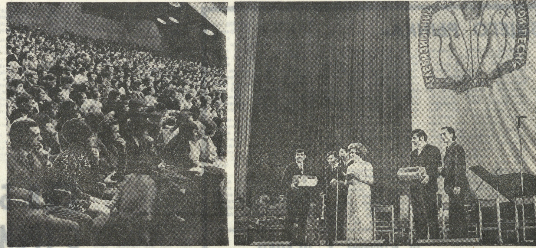
Ровно год назад было положено начало еще одной хорошей традиции — состоялся организованный по инициативе Свердловского горкома ВЛКСМ Уральского отделения Союза композиторов и Свердловского телевидения I фестиваль советской песни.