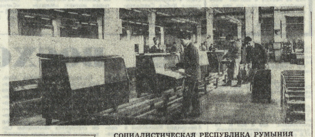
СОЦИАЛИСТИЧЕСКАЯ РЕСПУБЛИКА РУМУНИИ Из года в год увеличивается выпуск продукции мебельной фабрики в городе Васлуй. В текущем году экспорт мебели за рубеж и, в первую очередь в Советский Союз, предполагается повысить на 10 процентов по сравнению с 1971 годом. НА СНИМКЕ: монтажный цех мебельной фабрики в городе Васлуй.