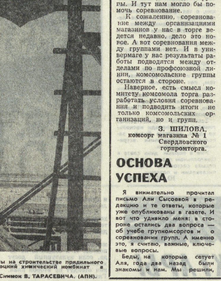
НА СНИМКЕ: монтажные работы на строительстве прикладного цеха производства нитрона (Получия химической комбинат в Белорусской ССР).