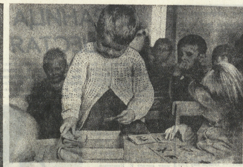
Около пяти тысяч детских садов открыто сейчас в сельской местности Польской Народной Республики. В страдную сельскохозяйственную пору во многих районах открываются дошкольные заведения.

нате одного из освобожденных районов страны. Родившаяся в сентябре 1965 года пионерская организация ПАИГК помогает партии решать активные строительные вопросы жизни, будущих граждан свободной и независимой Гвинеи (Бисау). Обучение воспитание подрастающего поколения — предмет особой заботы партии. Там, где устанавливается народная власть, сразу же строят школы. За 523 года колониального господства Португалии в Гвинеи (Бисау) только 12 местных жителей — африканцы получили среднее и высшее образование. Сейчас 23 тысячи ребят учатся в 157 школах, организованных на освобожденной территории. Лучшим из них школа дает путеше-