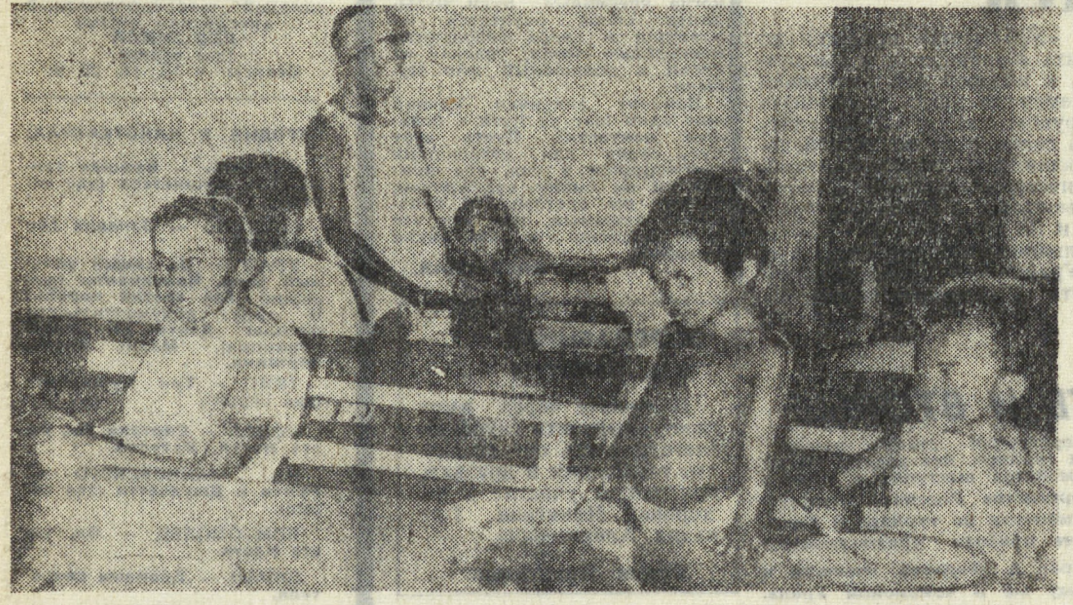
Бразилия — одна из стран, где отмечается бо́льшая смертность детей. По данным министерства здравоохранения страны, она составляет 55 процентов общей смертности. Из каждой тысячи рождающихся детей 105 умирают, не дожив до года. Причины высокой детской смертности — бедность, плохое питание, отсутствие медицинской помощи.