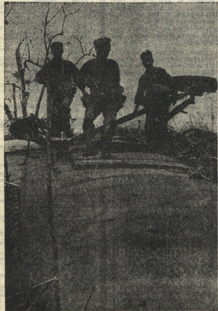
Лаос. Народно-освободительная армия Лаоса усиливает удары по противнику. Большие успехи достигнуты патриотами в западной части плато Валовен. Лаосские патриоты заняли военную базу Валангонг в 20 километрах к востоку от Пансе.