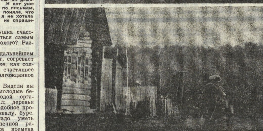
Пройдись по родному городу