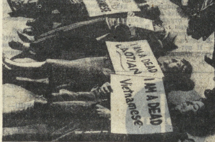
Мощная антивоенная демонстрация состоялась в Нью-Йорке у здания пользующейся печальной известностью во всем мире компании ИТТ — международного телефонного и телеграфного картеля. В последнее время стали известны факты о том, что ИТТ поставляет Пентагону электронное оборудование, которое используется в военных целях в Индокитае.