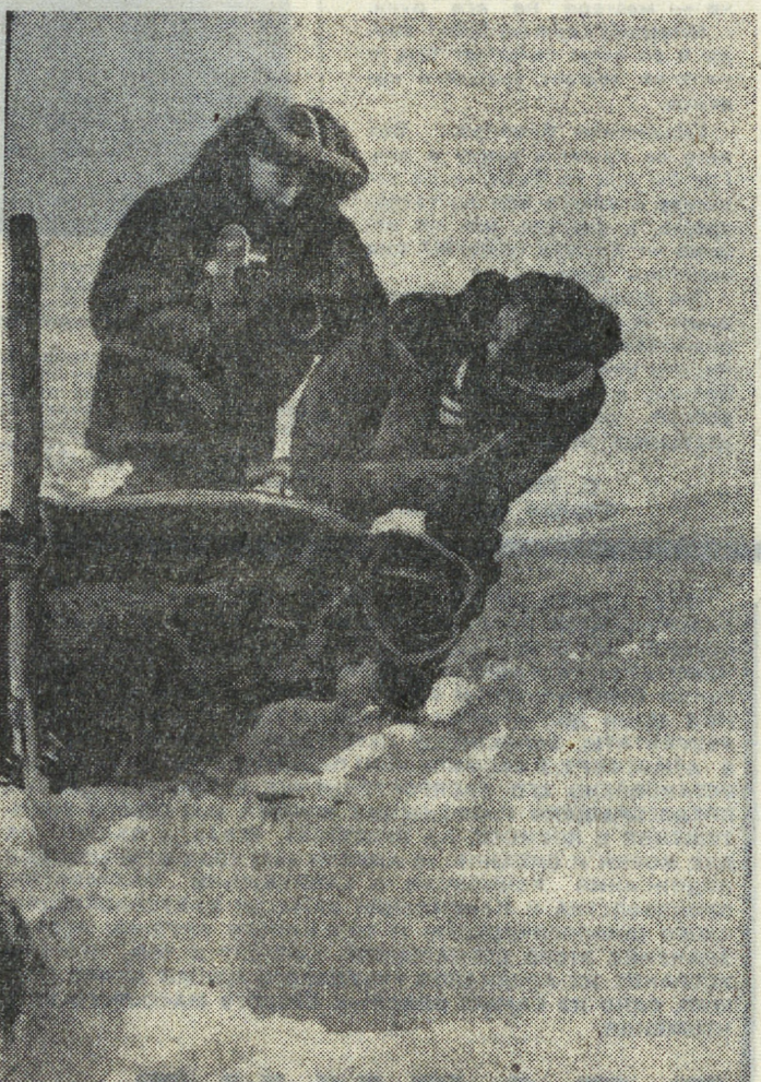
На снимках: первое знакомство; здесь, под снегом, живут медведи.

Ежегодно весной «Зоообъединение» ведет отлов белых медвежат для зоопарков страны. В этом году звероловы отправились в северо-западную часть острова Врангеля, в район горного хребта Дрем-Хед. Берлоги белых медведей расположены обычно на склонах гор под плотным снежным покровом. Звероловы находят лаз, который медведица делает весной для прогулок с медвежатами. И когда, обеспокоенная шумом, она выглядывает из берлоги, в животное направляют из пистолета или ружья легкий шприц, наполненный химическим веществом, которое, попав в организм, на время лишает медведицу способности двигаться. Такого зверя можно метить, брать у него пробы для физиологических анализов. А через несколько часов животное возвращается к нормальному состоянию. Отлов белых медвежат — дело сложное и не лишено риска.