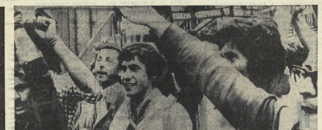
По всей Италии продолжаются предвыборные митинги и собрания Коммунистической партии в связи с предстоящим в мае выборами в депутаты ИКП призывают всех, кому дороги идеи подлинной демократии, отдать свой голос итальянской коммунистической партии, защищающей интересы широких масс. На снимке: участники одного из митингов в Риме.