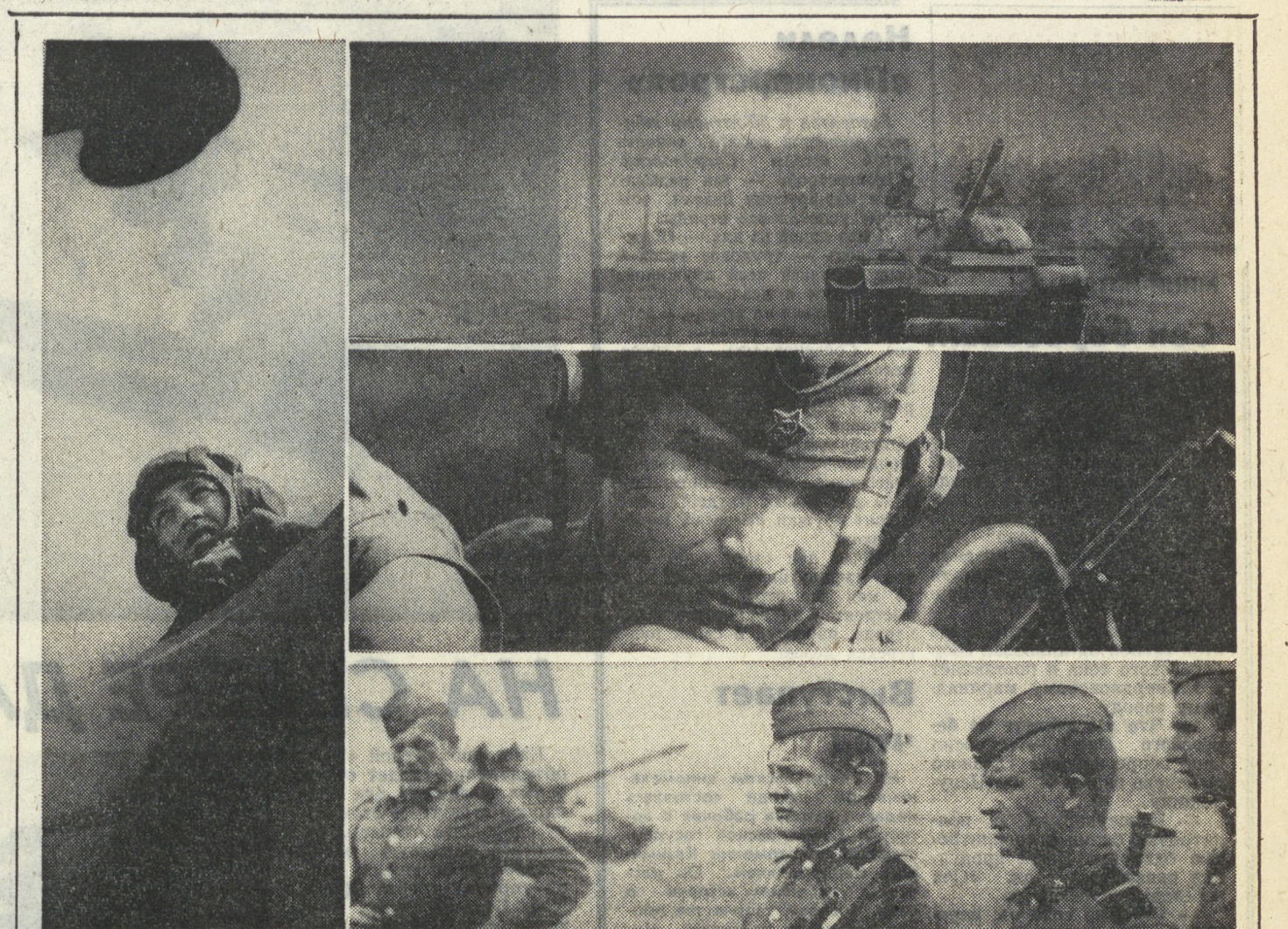
Темная ночь плотным покровом накрыла военный городок. Все, кажется, мирно спит. Кругом — настороженная тишина... И вдруг неожиданным горластым выхрем вырывается в казарму сигнал: «Тревога!» И сразу же все оживает, пришло в движение. Прошло совсем немного времени, и в парне боевых машин заурчали моторы, танки, выстроившись в колонну, двинулись в район сосредоточения. Идут они споро, несмотря на то, что местность для продвижения трудная — лес, овраги, разбитая дорога. Вот и рубят разветвлениями. И танки устремляются в атаку... «Бой» идет уже не один час. Вместе с танками в нем участвуют пехота и артиллерия. Далеко вперед выдвинулся наблюдательный пункт артиллеристов. Офицер засек цели, подготовил данные для ведения огня по «противнику», радист передает их на огневые позиции. Пролет немого времени, и ураганный шквал огня обрушивается на «противника»... В тул «врага» уходит разведчик. Последний инструктаж перед операцией... Ежедневно, ежедневно идет напряженная учеба воинов. Цель этих занятий — добиться мастерства, быть в постоянной боеготовности.